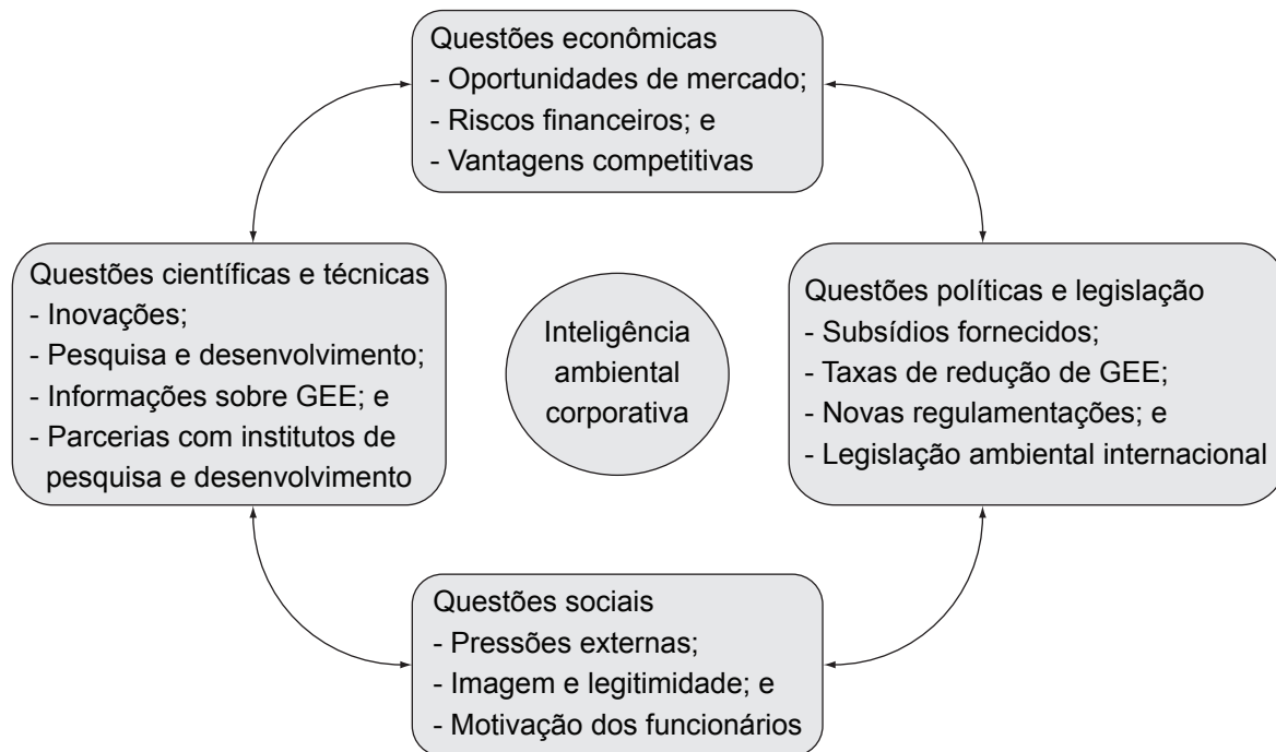
Figura 1. A inteligência ambiental empresarial: prospecções sobre a mudança climática, adaptado (BOIRAL, 2006).

e desenvolvimento, pautadas em banco de dados e informações sobre emissões de GEE. Por sua complexidade, o processo de inovação que considera questões de mitigação das emissões de GEE tende a envolver parcerias com institutos de pesquisa e universidades (BOIRAL, 2006).