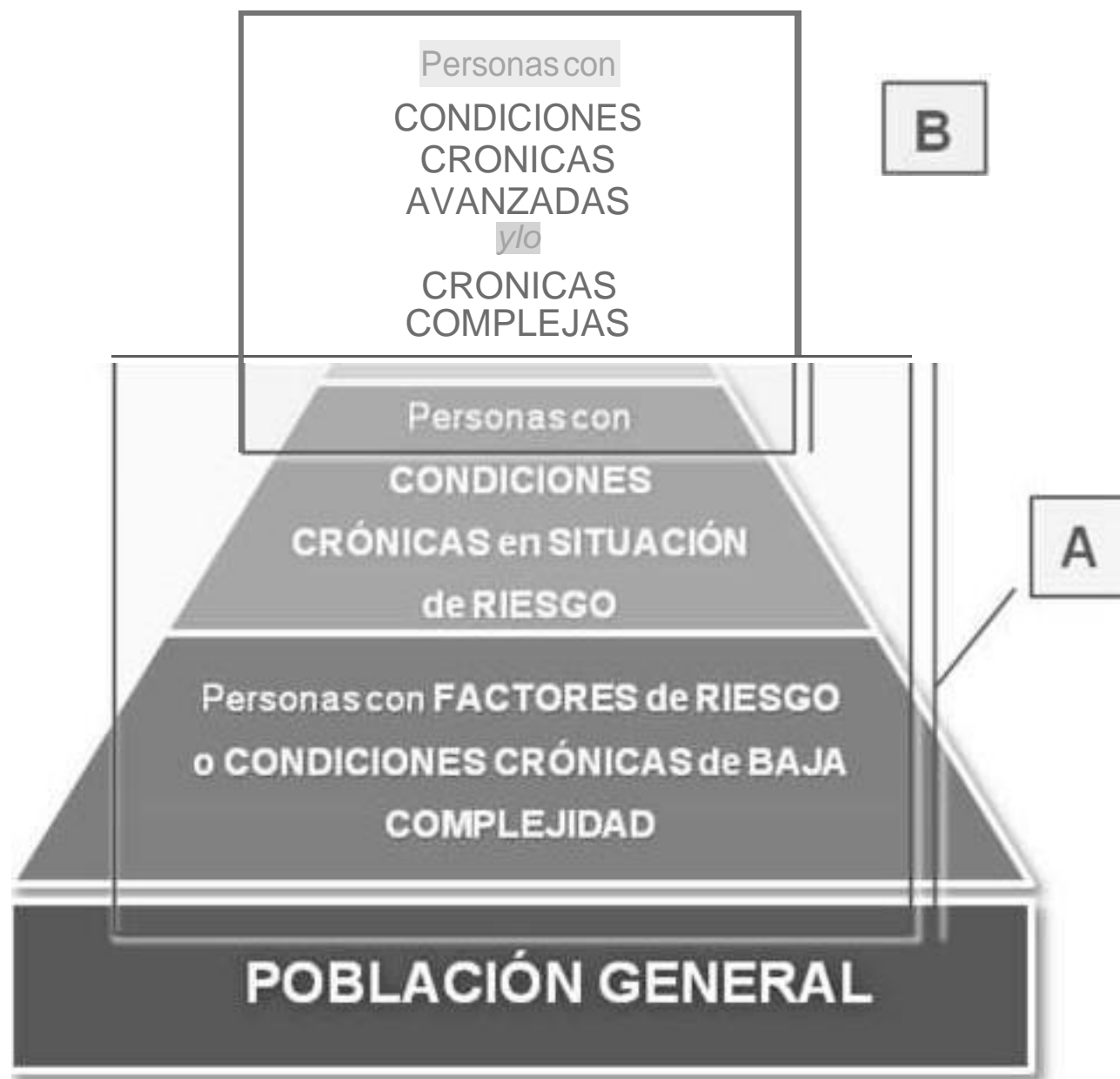
Figura 1 Click here to do""loaj high resolution image