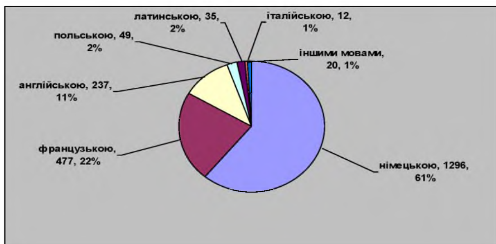
Діаграма 2. Мовний склад колекції

Проаналізувавши мовний склад колекції, виявлено що у ній зібрано документи, надруковані німецькою – 1296 (61%), французькою – 477 (22%), англійською – 237 (11%), польською – 49 (2%), латинською – 35 (2%), італійською – 12 (1%), іншими мовами – 20 (1%) (діаграма 2).