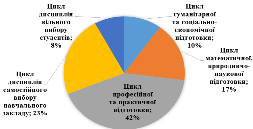
Рис. 1. Розподіл навчального часу за циклами підготовки бакалаврів за напрямом 6.050102 «Комп'ютерна інженерія»

Відповідно до ОПП бакалаврів комп'ютерної інженерії, навчальна дисципліна «Фізика» складається зі змістових модулів «Механіка», «Електрика і магнетизм», «Оптика», «Квантова фізика» та розкривається у наступних темах: «Кінематика і динаміка», «Моделі класичної механіки», «Робота та енергія», «Основи теорії відносності», «Електричне поле», «Постійний електричний струм», «Змінний електричний струм», «Магнітне поле», «Електромагнітна індукція. Рівняння Максвелла», «Хвильова оптика», «Інтерференція. Дифракція. Поляризація. Дисперсія», «Теплове випромінювання. Фотони», «Модель атома. Рівняння Шредінгера», «Елементи фізики твердого тіла».