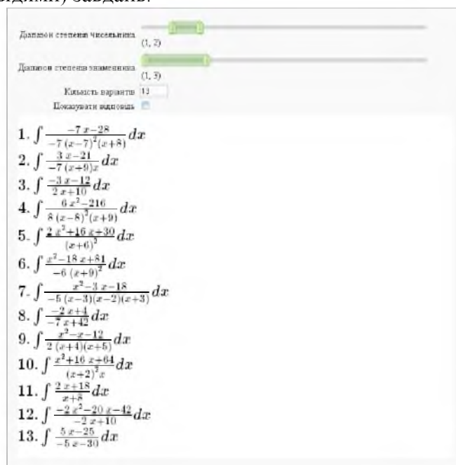
Рис. 2. Інтерфейс генератора завдань з теми «Інтегрування раціональних функцій».

На рисунку 2 зображено інтерфейс генератора завдань з теми «Інтегрування раціональних функцій». Можливість зміни степенів многочленів у чисельнику та знаменнику дозволяє згенерувати довільну, наперед задану кількість (за бажанням користувача – із відповідями) завдань.