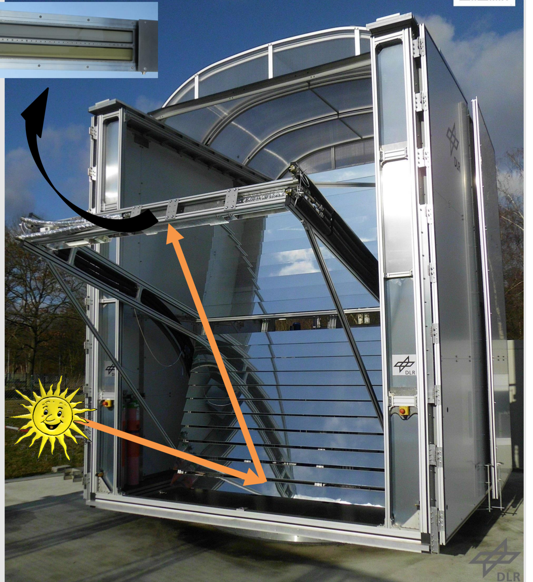
Abbildung 1: Zweiachsig nachgeführter Konzentrator-Teststand SoCRatus mit in der Fokalebene montiertem Zweikammer-Suspensionsreaktor

Bei den Versuchen kamen der Teststand SoCRatus und ein Zweikammer-Suspensionsreaktor zum Einsatz (siehe Abbildung 1). Der Suspensionsreaktor empfing homogene, etwa 17,5-fach konzentrierte Solarstrahlung in der Fokalebene des Konzentrators, wobei der Photokatalysator Photonen absorbierte, was schließlich zur Bildung von H 2 führte. Die maximale H 2 -Produktion lag bei 7386 μmol/h bzw. 338,2 μmol/h. Das Verhältnis zwischen der chemischen Energie, die das photokatalytische System in Form von H 2 (Heizwert) verließ, und der eingekoppelten Solarstrahlung wurde für unterschiedliche spektrale Bereiche und Temperaturniveaus als Solar-zu-H 2 -Effizienz bestimmt (siehe Abbildung 2). Es zeigt sich, dass das untersuchte TiO 2 deutlich höhere Solar-zu-H 2 -Effizienzen im Vergleich zu SnNb 2 O 6 ermöglicht und sich steigende Temperaturen tendenziell positiv auswirken. Bei 50°C konnte im UV-Bereich eine Effizienz von 15,6% erreicht werden. Die Wirkungsgrade für das Gesamtspektrum liegen bei maximal 0,18% bzw. 0,014%. Die Ergebnisse dienen als Referenz für die weiteren Entwicklungen im Rahmen des Projektes.