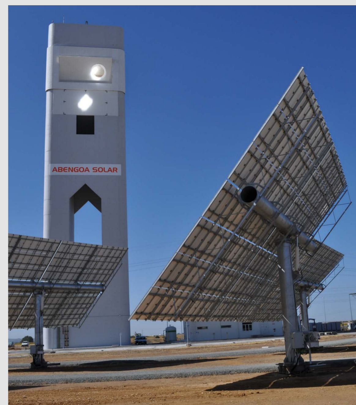
Bild 1: SOLUGAS-Anlage mit Heliostaten auf Kalibriertarget und Receiver

Die Simulationen werden mit dem DLR-Raytracing-Programm „STRAL“ erzeugt.