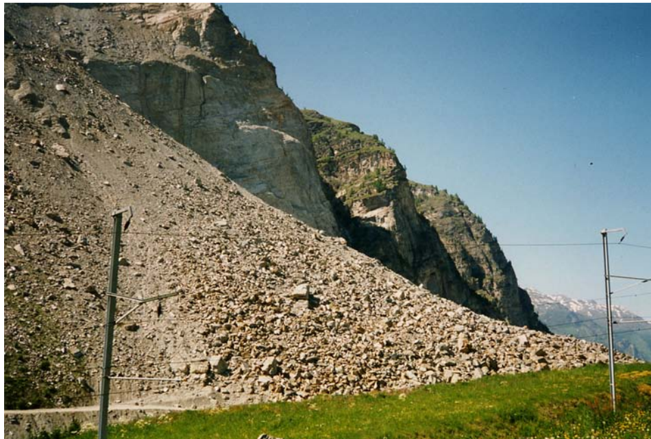
Fig. 3 L'éboulement de Randa en 1991. Cet éboulement a barré l'écoulement de la Vispa, provoquant la formation d'un lac. L'accès à la station de Zermatt, par le train et par la route a été perturbé pendant plusieurs semaines.

Enfin, il faut relever les impacts des activités et infrastructures touristiques sur les formes et processus géomorphologiques (5), des impacts qui doivent être jugulés, afin que le tourisme ne tue pas ce qui constitue sa matière première : le paysage.