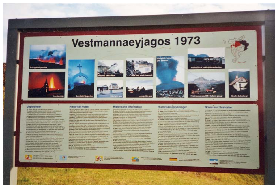
Fig. 2 L'île de Heimaey : l'éruption volcanique de 1973 a permis le développement d'une offre touristique nouvelle pour le village islandais de Vestmannaeyjar (photo : S. Fischer).

hautes vallées du Népal ou du Cachemire subissent actuellement une érosion de la fréquentation touristique liée aux troubles politiques qui les caractérisent. Ce potentiel varie également en fonction de l'évolution de la demande touristique. Ainsi, les cascades, qui ont représenté l'élément emblématique du paysage alpin aux XVIIIe et XIXe siècles (Reichler 2002) et encore au début du XXe siècle, au moment où les rivières alpines étaient peu à peu asséchées par des captages hydroélectriques (Gauchon 2002), n'ont plus maintenant le même potentiel d'attraction auprès du public touristique. Le potentiel touristique des cascades et des rivières n'est plus aujourd'hui lié à leur seul esthétisme, mais à leur capacité à fournir de nouveaux terrains de jeux aux adeptes de sports extrêmes que sont le canyoning ou le rafting par exemple, comme l'ont montré lors du colloque P. Mao et M. Léonard.