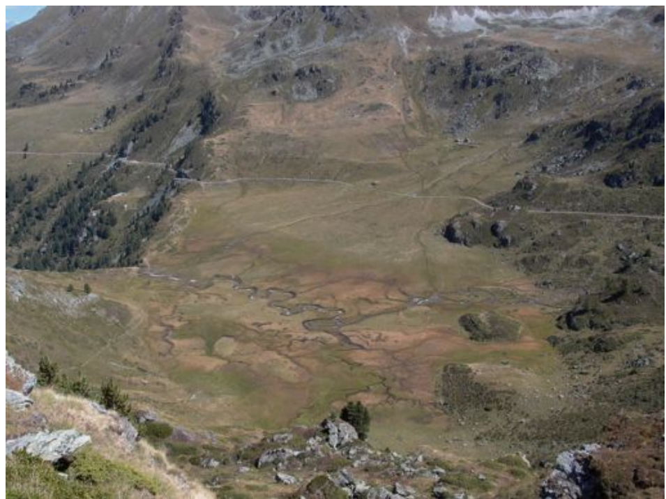
Fig. 4 L'Ar du Tsan, un paysage marécageux développé dans une morphologie glaciaire alternant ombilics et verrous (photo : E. Reynard, prise lors de l'excursion du séminaire CUSO 2003).