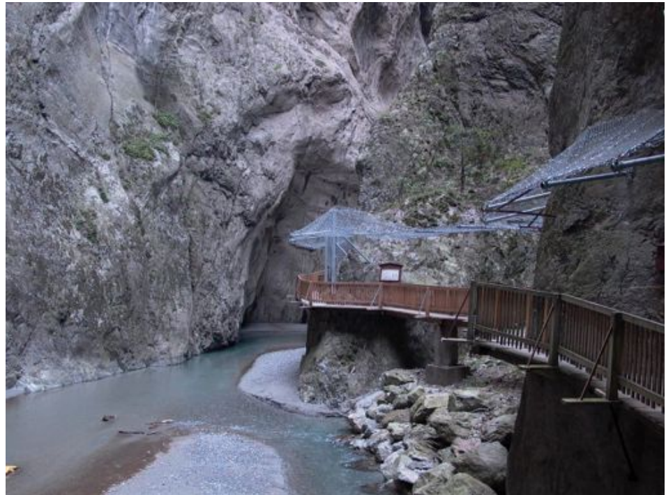
Fig. 3 Les gorges du Trient, un paysage inscrit à l'IFP. Il s'agit d'un des nombreux « paysages géomorphologiques » inscrit dans cet inventaire fédéral.