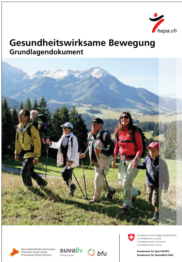
Abbildung 1: Die 2013 erschienene neue Ausgabe des Schweizer Grundlagendokuments gesundheitswirksame Bewegung enthält unter anderem eine Aufzählung der Gesundheitseffekte regelmässiger Bewegung, die aktuellen nationalen Bewegungsempfehlungen für verschiedene Altersgruppen sowie einen Überblick über wirksame Ansätze der Bewegungsförderung ( www.hepa.ch ). I

Figure 1: «Activité physique et santé. Document de base»: La nouvelle version parue en 2013 du document thématique dédié à l'activité physique, garante de la bonne santé de la population suisse, contient notamment un inventaire des effets bénéfiques exercés sur la santé par une activité physique régulière, les plus récentes recommandations à l'échelle nationale en matière de activité physique s'adressant aux différentes tranches d'âges, ainsi qu'une liste des initiatives ayant démontré leur efficacité à promouvoir l'activité physique ( www.hepa.ch ).