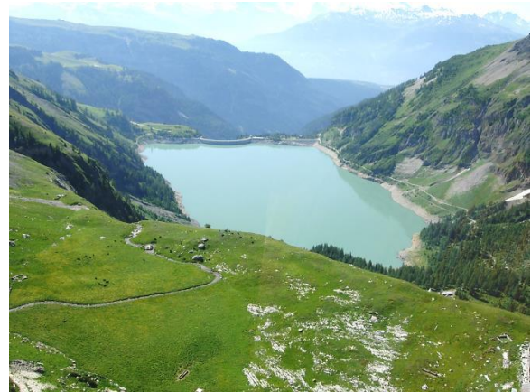
Le lac de Tseuzier, lac de barrage pour l'hydroélectricité, stocke aussi de l'eau pour l'irrigation, l'enneigement artificiel et l'approvisionnement en eau potable

De plus, la région présente trois réseaux hydrauliques distincts: celui du Haut-Plateau (les six communes concernées par la station touristique de Crans-Montana), celui de Sierre et ses communes limitrophes et celui de St-Léonard. S'il existe une certaine collaboration entre les communes à l'intérieur de chaque réseau, ces trois réseaux ne sont cependant pas raccordés entre eux, que ce soit à cause de leur situation géographique (la commune de St-Léonard est isolée des autres communes), à cause d'une absence de planification et d'une faible coordination entre communes voisines (on pense ici aux communes du Haut-Plateau et à celles de la Noble Contrée de Sierre).