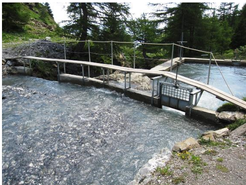
Prise d'eau d'irrigation du bisse de Tsittoret sur le torrent de la Tièche

Si ce système a bien fonctionné jusqu'à maintenant, c'est principalement grâce à l'actualisation et la reproduction de certains référentiels partagés par les acteurs en place et utilisés comme une légitimation des pratiques de gestion. Ainsi, les stratégies de gestion de la région de Crans-Montana-Sierre restent dans cette optique, motivées par des facteurs économiques de cette région de montagne où l'eau fait partie intégrante de l'offre touristique.