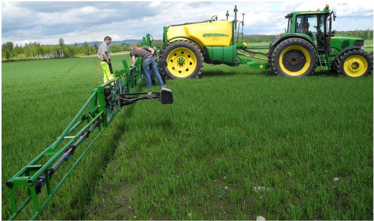
Figur 3. Innovasjon for fleksisprøyting av herbicid mot frøugras i korn (spannmål) eid av norske Dimension Agri Technologies AS. En kamera-basert sensor per seksjon av åkersprøyta styrer seksjonens dyser av og på ettersom den beveger seg over områder hhv. over og under skadeterskel. Terskelen er basert på indexen 'relative weed cover'.

For stedsspesifikk sprøyting av herbicider på areal hvor det ikke er nødvendig å skille mellom ugras og kulturplante, er den kommersielle WeedSeeker ( www.trimble.com/Agriculture/weedseeker.aspx ) som har sensor og dyse integrert, en mulig metode. En indirekte metode kan være prediksjonsmodeller basert på geografiske data (satelittbilder, terrengmodeller) og som har en sammenheng med utvikling av plantevernproblemet som bl.a. vist i svensk havre for Fusarium og mykotoksiner (Söderström & Börjesson, 2013). Områder med høy risiko for mykotoksin kan da høstes separat. En bok redigert av Oerke et al. (2010) gir innblikk og bred oversikt over internasjonal forskning og utvikling på temaet sensorer og plantevern.