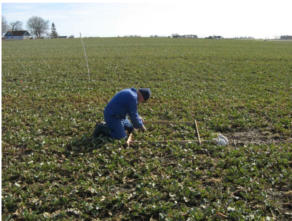
Figur 6. Alla grödsensorer måste kalibreras mot mätningar och vägningar av plantmaterial från fält med olika beståndstätheter. Här höstoljeväxter på våren.

Grödans färg är starkt sammankopplad med klorofyllhalten och därmed kväveinnehållet i växten, tillsammans med bestämningen av tätheten i biomassan fördelar sedan sensorn givan. Efter att ha angett typ av gröda och i vilket utvecklingsstadium grödan befinner sig i kalibreras sensorn utifrån ett referensområde på fältet där grödan ser normalt utvecklad ut. Man kan även anlägga nollrutor som referenser, men det kräver en handburen sensormätare, vilket inte är så vanligt. Sensorn fungerar att använda i all stråsåd, från bestockningsfasen i höstsåd och från stadie 31 (början av stråskjutningsfasen) i vårsåd ( www.yara.se ). Även i oljeväxter fungerar sensorn bra, särskilt till andra givan på våren, då har vissna blad försvunnit och plantorna täcker jorden bra (Gunnarson, 2010).