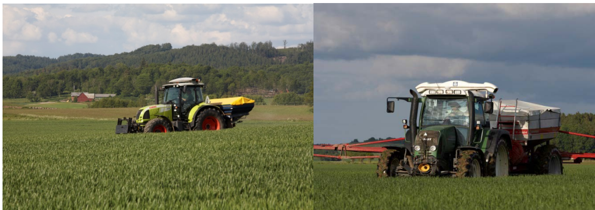
Figur 5. Yara N-Sensor, t. v vanlig solljusberoende sensor och t. h. ASL-modellen som kan användas dygnet runt.

Grödans färg är starkt sammankopplad med klorofyllhalten och därmed kväveinnehållet i växten, tillsammans med bestämningen av tätheten i biomassan fördelar sedan sensorn givan. Efter att ha angett typ av gröda och i vilket utvecklingsstadium grödan befinner sig i kalibreras sensorn utifrån ett referensområde på fältet där grödan ser normalt utvecklad ut. Man kan även anlägga nollrutor som referenser, men det kräver en handburen sensormätare, vilket inte är så vanligt. Sensorn fungerar att använda i all stråsåd, från bestockningsfasen i höstsåd och från stadie 31 (början av stråskjutningsfasen) i vårsåd ( www.yara.se ). Även i oljeväxter fungerar sensorn bra, särskilt till andra givan på våren, då har vissna blad försvunnit och plantorna täcker jorden bra (Gunnarson, 2010).