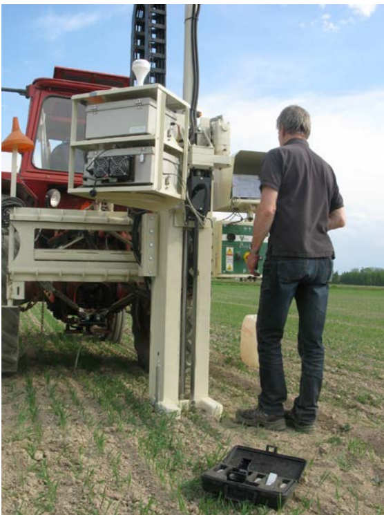
Figur 2. Test på Lanna Försöksgård i västra Sverige av Veris jordprovtagare som med NIR-teknik kan analysere markens ler- og mullhalt.