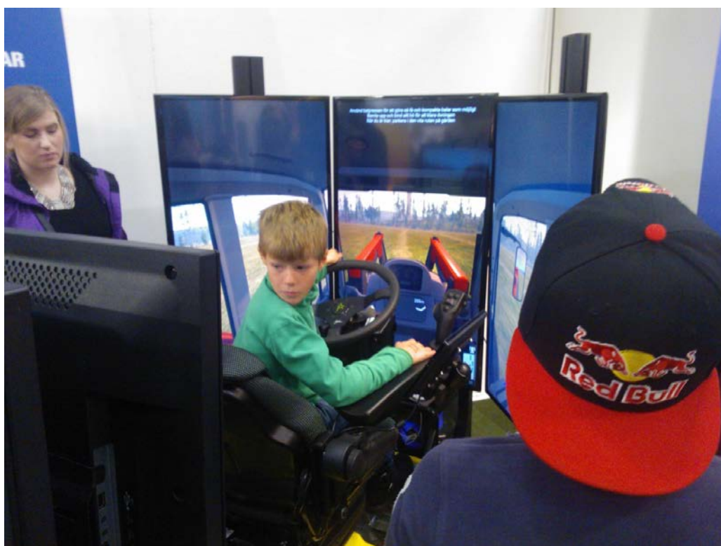
Figur 7. Utbildning av precisionsteknik kan starta i tidiga år genom simulatorbaserad inläring.