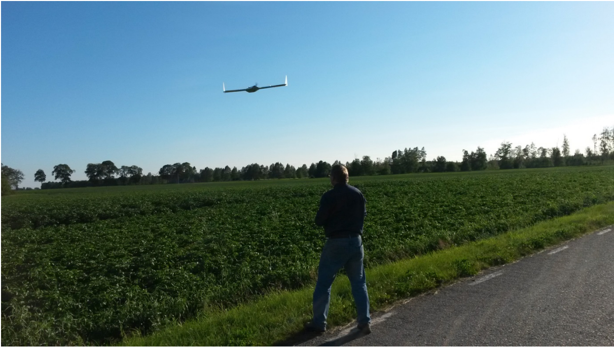
Figur 4. Med en sensor monterad på en s. k. drönare eller UAV (obemannad flygande farkost) kan man snabbt och enkelt scanna av gårdens olika grödor.

Grödsensor finns i ett par olika slag, varav Yara N-Sensor, Trimbles GreenSeeker och OptRx är de märken som finns i Sverige (pers. medd. Nissen, 2014). N-Sensorn är den variant som är vanligast förekommande i Skandinavien. Den finns i två varianter. En med egen lyskilde som er oberoende på daglys. Og en som er beroende på dagljus, men er billigare och mest utbredd. Metoden bygger på ett antal sensorer som monteras på en ramp som monteras på traktorns tak.