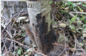
Jonäs Oliva, SLU

P. alni är ett komplex av underarter och hybrider som upptäcktes i Storbritannien under tidigt 1990-tal. Första observationen i Sverige gjordes i mitten av 1990-talet. Arter är jord- och vattenburen. Sprids effektivt mellan kontinenter med handeln av framförallt prydnadsväxter.