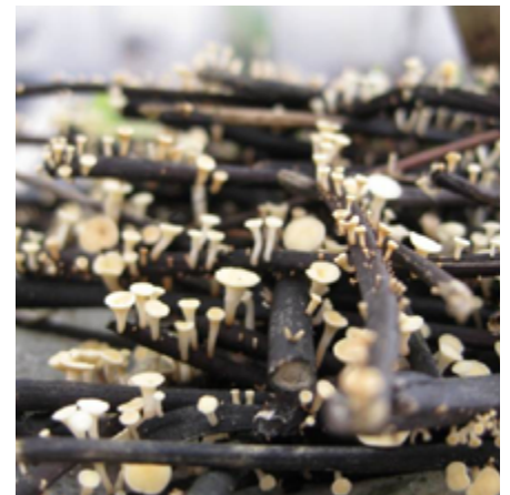
Fruktkroppar av svampen Hymenoscyphus fraxineus , som orsakar askskottsjukan och har spritt sig snabbt i norra Europa sedan början av 1990-talet.

Gemensamt för alla invasiva skadegörare är att de transporteras till sina nya platser av oss människor. Spridningen av nya skadegörare till nya kontinenter och länder såväl som inom länder är direkt relaterad till mängden handel. Forskningen har visat att den största risken är förknippad med transport av levande växter som är avsedda för utplantering samt trä och träprodukter. Handel med gröna växter är reglerad i EUs lagstiftning, med målet att inte handla med sjuka växter. Det finns dock ett stort mörkertal eftersom växtsjukdomar kan finnas latent utan symptom under långa perioder och insekternas vilostrukturer och ägg kan vara svåra att upptäcka. Dessutom transporterar vi jord tillsammans med växterna som kan vara bärare av insekter och svampsporer.