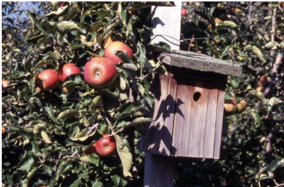
Fuglekassar som førebyggjande tiltak mot skadedyr.

Mange av larvene som høyrer til gruppane målarar, nattfly og viklarar, som et på bladverk og på utsida av epla, kan gjere stor skade. Fugl er eit viktig nyttedyr mot slike larver (sjå avsnittet om førebyggjande plantevern).