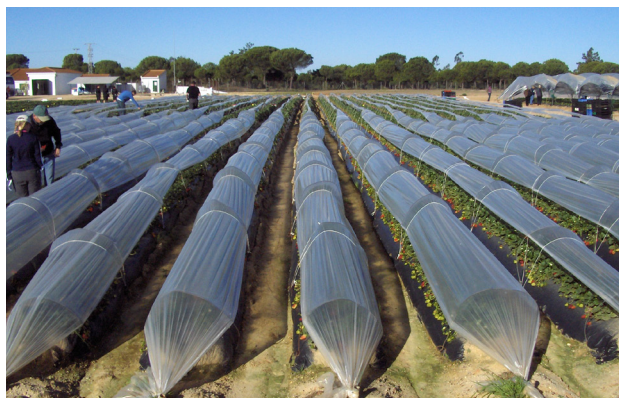
Både tunnelar, fiberduk og solfangarar kan nyttast for driving av jordbær.