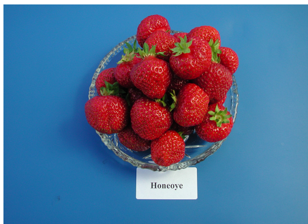
'Honeoye' er tidleg og er nytta i økologisk dyrking i Danmark.

Jordbærplanta er svak mot fleire sjukdommar og skadedyr, men det er ein del skilnader mellom sortane. I økologisk jordbær dyrking er difor sjukdomsresistens viktigaste eigenskapen å ta omsyn til ved val av sort.