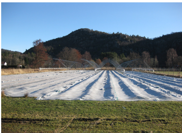
Dekking med fiberduk kan hindra frostskaade både om vinteren og i blomstringa om våren.

tiltak vil gi raskare etablering ved nyplantning, auke avlinga, gi tidlegare modning, redusere vinterskade og sjukdomsangrep. Fiberduk er relativt rimeleg i bruk og kan gi god effekt. Effekten vil likevel variere frå stad til stad og frå år til år. Plasttunnelar eller veksthus gir betre styring med klimaet og kan forlengje sesongen i begge endar. I tillegg gir det sterk reduksjon av soppangrep fordi ein unngår regn direkte på bæra. Både fiberduk, plasttunnelar og veksthus kan derimot gi auka angrep av jordbærmidd, spinnmidd og mjøldogg.