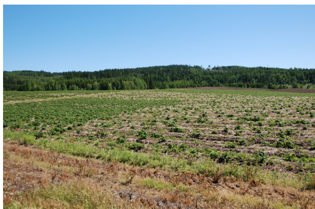
Felt av Florence med kraftig vinterskade. Verknaden av vinterdekke er tydeleg.