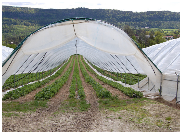
Jordbær i opne tunnelar i Norge.