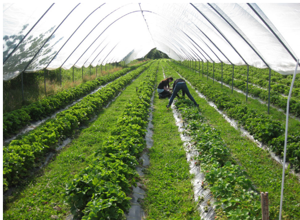
Dyrking i tunnel gir tørre forhold.