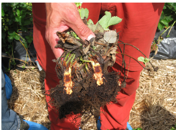
Gråskimmel (t.v.) og rotstokkråte er vanlege soppsjukdomar i jordbær.