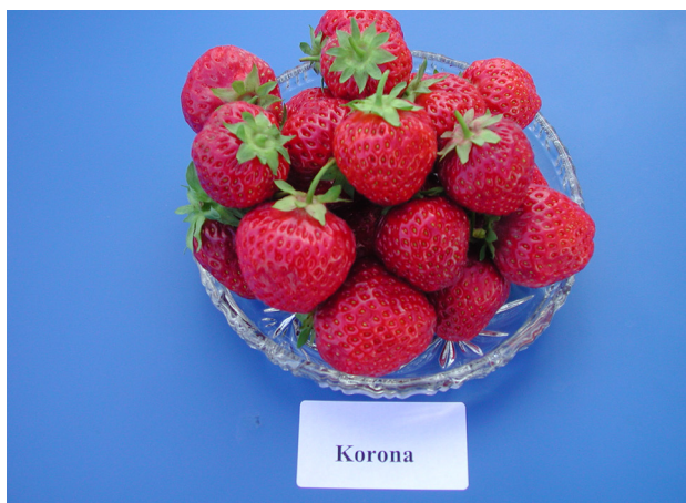
'Korona' smakar godt og er hovudsorten i Norge. Høver best for direktesal.

Det er særleg i motstandskraft mot soppsjukdommar ein finn skilnader mellom sortar. Ved dyrking på friland er både gråskimmel og mjøldogg viktige sjukdomar. I tunnel er særleg mjøldogg utfordrande.