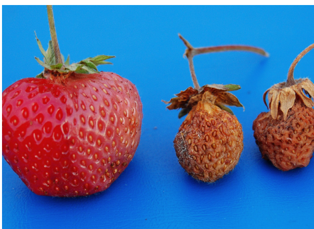
Lærrote kan vise seg både på kartbær.

Lærrote ( Phytophthora cactorum ) kan gi rote på bæra, særleg etter kraftig regnver eller vatning som gir jordsprut og dermed smitte på bæra. Grøne bær vil først bli grå-bleike og svampaktige, seinare vil dei bli brune og tørke inn, og bæra får ein bitter smak eller "medisinsmak". Lærrote kan likne på gråskimmel, men gir inntørka bær, mens gråskimmel gir ein blaut rote. Lærrote har mycel som ser ut som eit kvitt belegg, mens mycel av gråskimmel er grått og loddent. 'Polka' er svak mot lærrote, medan 'Senga Sengana' er sterk. Dekking av jorda med halm, plast, bark og liknande