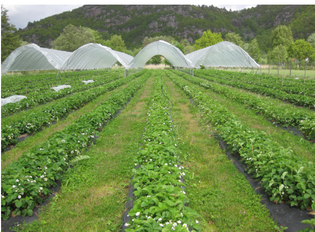
Det er vanleg å dyrka på låg drill med eller utan plast. Også heildekke med plast kan vera aktuelt, men det er viktig med smale rader og open plantebestand.