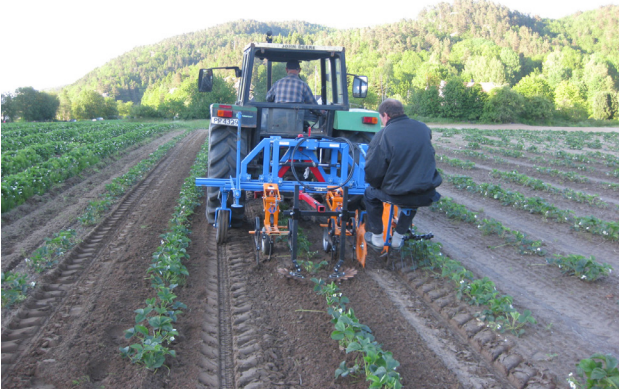
Radrensing med fingerhjulstyr.