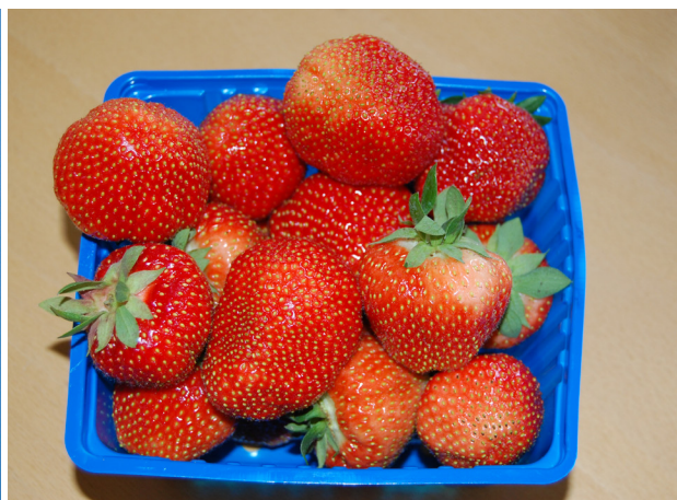
'Sonata' er ny og lovande og bør prøvast meir i økologisk dyrking.

'Senga Sengana' er den eldste og best kjende sorten i dyrking i dag. Plantene har frodig vekst og vert lett for kraftige og tette ved sterk gjødsling. 'Senga Sengana' gir god avling og god kvalitet. Bæra er relativt søte og aromatiske. Sorten er sterk mot rotstokkrote, lærrote og mjøldogg, men 'Senga Sengana' er sterkt utsett for gråskimmel og derfor mindre aktuell i økologisk dyrking på friland. I tunnel kan sorten derimot vera eit alternativ.