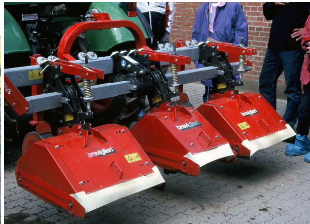
Med rekkefres kan det gjerast godt ugrasarbeid.

våren eller etter hausting i eldre felt. Mellom radene kan grovare redskap brukast, som radrensing eller fres. Det kan ta det meste av ugraset, men grunne røter vil også bli øydelagde ved slik behandling. Sortane har ulik toleranse for strigleharving. 'Korona' ser ut til å vere svak, og nyplantingar tåler mindre enn eldre felt.