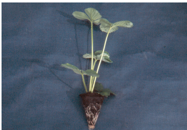
Jordbærstiklingar klare for stikking og plugglante med friske røter klar for utplanting.