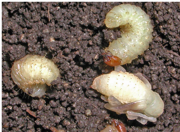
Larver og puppe av rotsnutebille.