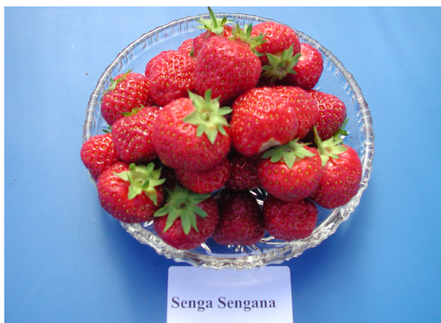
'Senga Sengana' gjev god avling og gode bær. Veksten er kraftig og bæra rottnar lett.

'Korona' er hovudsort i Norge i dag. Sorten gir stor avling og store, fine bær med god kvalitet som ferske dessertbær, men kan og brukast til sylting. Bæra tåler lite handling og vert lett stygge, så det er særskrevjande å ta vare på den gode kvaliteten i sal og omsetnad. 'Korona' er svak mot soppsjukdomane øyeflekk, mjøldogg og rotstokkrote, men relativt sterk mot vinterskade. I tunnel vert det ofte mykje mjøldogg både på bær og blad, men på friland er plantene bra friske og kan høva bra i økologisk dyrking med rask omsetnad lokalt.