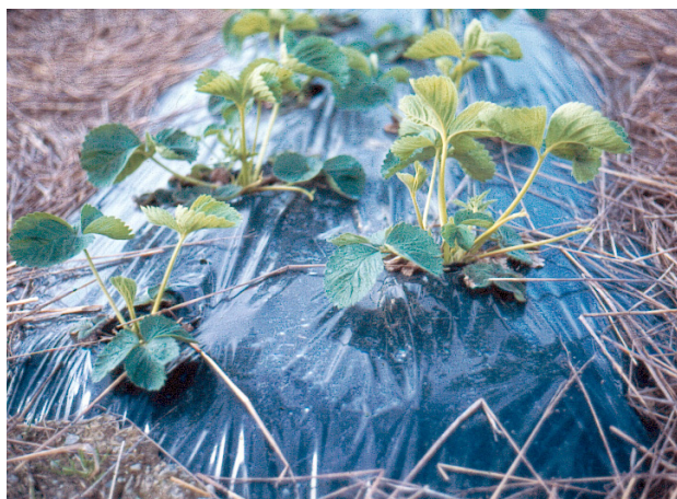
Godt dekke av halm eller plast hindrer ugrasvekst, men halmen må helst fornyast kvart år.