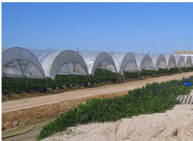
Tunnelar for jordbær dyrking i Spania.

Også andre klimafaktorar vert endra i tunnel i forhold til friland. Inne i tunnelane vil det bli ganske vindstille, det er som regel ein fordel for planteveksten. Relativ fuktigheit er oftast om lag den same inne i tunnelane som ute, men stillestående luft gir lettare doggfall, som reduserer fordelane med tunnelen. Plastfolien slepper gjennom berre 60-85 % av lyset, slik at det vert mindre lys i tunnelane enn ute. Det forverrar seg med alderen på plasten.