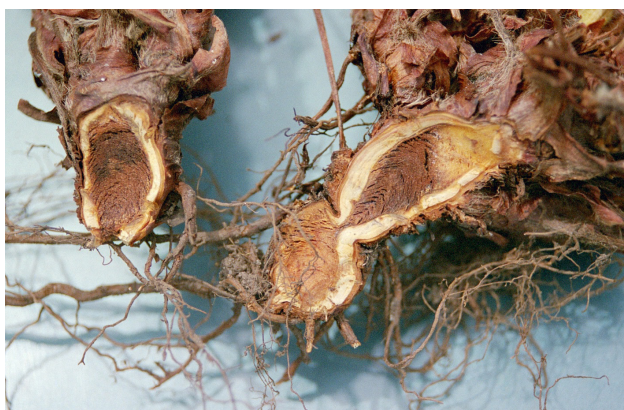
Frostskade hos midtkrona hjå jordbær.