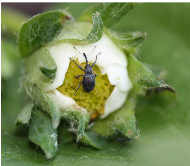
Jordbær snutebille i blomsten.

skade, men er eit symptom på at billa er til stades i feltet. Larvane er krumme, 1-2 cm lange og som regel kvite. Dei lever i jorda og gneg på røtene eller rotstokane, og ved sterke angrep kan skaden vere total. For å unngå stor skade må det ikkje plantast på jord der det har vore sterke angrep tidlegare. Forsiktig gjødsling med nitrogen synest vera positivt mot angrep, mens bruk av plastdekke på lett jord ofte gir store angrep. Felt med angrep kan behandlast med preparatet Nemasys H ( Heterorhabditis megidis ). Det inneheld nematodar som lever på larver av mellom anna rotsnutebiller. Det kan ofte gje god verknad når nematodane vert vatna ut med ca 25 000 stk/plante to gonger med åtte dagers mellomrom når jordtemperaturen er over 10 °C. Det kan gjerast med åkersprøyte der alle filter er fjerna. Behandlinga er relativt dyr og arbeidskrev-