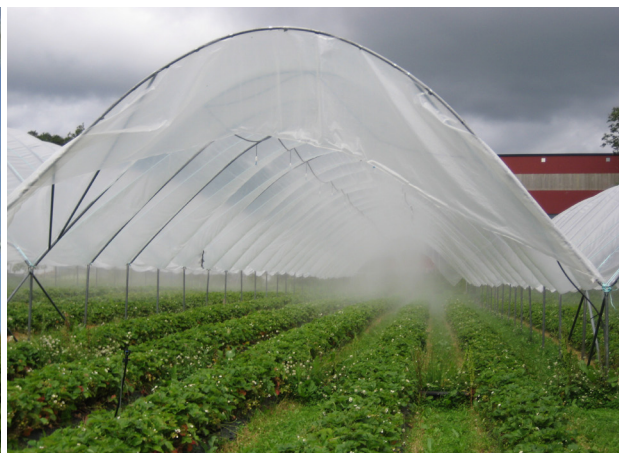
Tåkeanlegg demper temperaturen i tunnelane i periodar og kan ha ein viss effekt mot midd og mjøldogg.