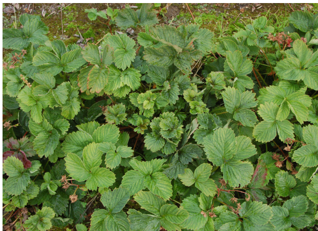
Planter kraftig svekka av jordbærmidd.

Jordbærsnutebille ( Anthonomus rubi ). Billa er svart og 2-4 mm lang og vert sjeldan lagt merke til, men avbitne knoppar syner at billa er der. Vaksne biller legg egg i