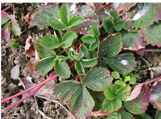
Øyeflekk kan også angripe bær, men er mest vanleg på blad.