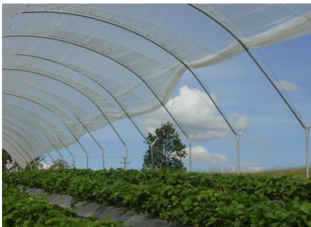
Lufting kan gjerast nokså enkelt.