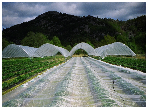
Dekking i blomstringa kan gi meir misforma bær og redusert avling og bærstorleik.

Jordbærplantene er utsette for vinterskade over heile landet. Allereie ved 4-5 kuldegrader kan dei få så stor skade at det går ut over avlinga. Lavare temperaturar - og særleg lengre periodar med lave temperaturar - aukar faren for skade. Periodar med vekslende kulde og mildvær er også svært uheldig for plantene fordi herdinga då kan verte oppheva mellom kuldeperiodane. Eit stabilt snødekke gir beste vernet mot vinterskade, men er ikkje alltid å stole på. Fiberduk eller vevd duk har vist seg å gi godt vern mot vinterskade i jordbær sidan temperaturen då endrar seg seinare enn på friland. På utsette stader kan ein gjerne bruke to lag duk som gir endå betre vern. Der det er mykje vind, kan det vera behov for eit noko tyngre og kraftigare dekke (Agrocover) over fiberduken. Også halm gir god isolasjon, men er meir arbeidskrevjande. Dersom halmen vert lagt på for tidleg om hausten, eller vert