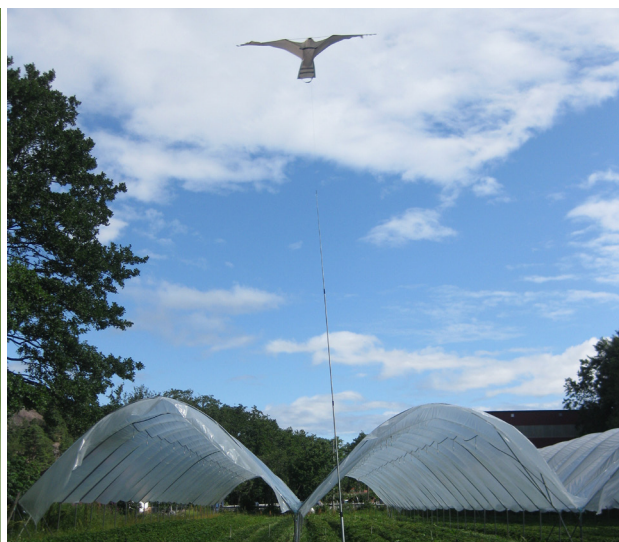
Det er ulike fugleskremsel å få kjøpt.