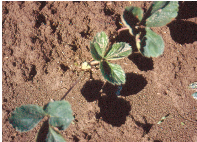
Her er plantene sette for djupt og det vil tas vært lang tid før dei tek til å veksa.

Plast er tillate i økologisk dyrking og er eit enkelt og rimeleg tiltak mot ugras. Dyrking på plast vil i tillegg gi betre etablering og plantevekst første året. Ulempene med plast er auka fare for angrep av rot-snutebille, særleg på lett jord, og meir arbeid med etablering og rydding.