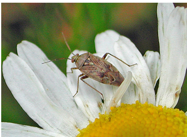
Tege i jordbærblomsten og knartbær som kan verta utvikla etter skade av tege.