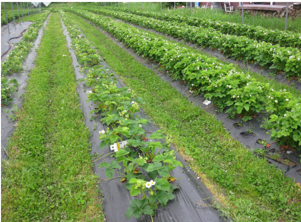
Vårplanting (til høgre) gjev større avling enn haustplanting første året.

Vanlege dyrkingsmåtar i Norge er på drill med eller utan plast. Ved planting utan plast vil mange av utløparplantene rota seg til ein tett mattekultur. I økologisk dyrking er også heildekke med plast aktuelt, fordi det forenkler ugraskampen og fordi ein har lite bruk for å køyre i feltet. Både enkeltrader og dobbeltrader er vanleg. I økologisk dyrking er det viktig å ha open og luftig plantebestand som tørkar raskt opp etter regn og vatning. Bruk av enkle rader er difor det beste, fordi bær og planter då vil vera mindre utsette for sjukdommar. Ved planting på dobbeltrad, vert det fleire planter, større avling per dekar og mindre kostnader med plast og dryppvatning. Det vil likevel vera lettare å få god avling og kvalitet ved bruk av enkeltrader og plastdekke.