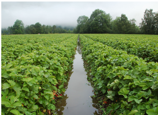
Etter mykje nedbør kan det stå vatn mellom drillane.

I økologisk jordbær dyrking er det derfor viktig med korte kulturar - tre eller fire år - og godt vekstskifte. Det bør helst vera andre vekstar i fire-fem år før det på nytt vert planta jordbær. Gras, korn og potet er gode forkulturar for jordbær, sjølv om potet kan gi auka angrep av Rhizoctonia på svake sortar som 'Honeoye'. Erter og havre har særleg god verknad mot jordbuande nematodar. Oppformering av ein-sidig ugrasflora kan ofte vera eit problem i jordbær, fordi jordbærplanta konkurrerer dårleg med ugraset. Med ein-sidig jordbær dyrking kan vanskelege ugrasartar derfor lett ta overhand og redusere vekstvilkåra for jordbæra.