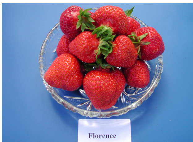
'Florence' er svært sein med faste bær med god gjennomfarging.

'Polka' har svært god bærkvalitet med faste og aromatiske bær. Bæra er gode både som dessertbær og til sylting. På yngre planter og tidleg i sesongen gir sorten store bær, men bærstorleiken minkar fort utover i sesongen og på eldre felt. 'Polka' er svak for soppsjukdomen lærrote og også litt svak mot mjøldogg. Plantene etablerar seg raskt i feltet, men er litt tørkesvake. 'Polka' er ein aktuell sort for økologisk dyrking og har over tid vore den beste i forsøk med økologisk dyrking på Sørlandet.