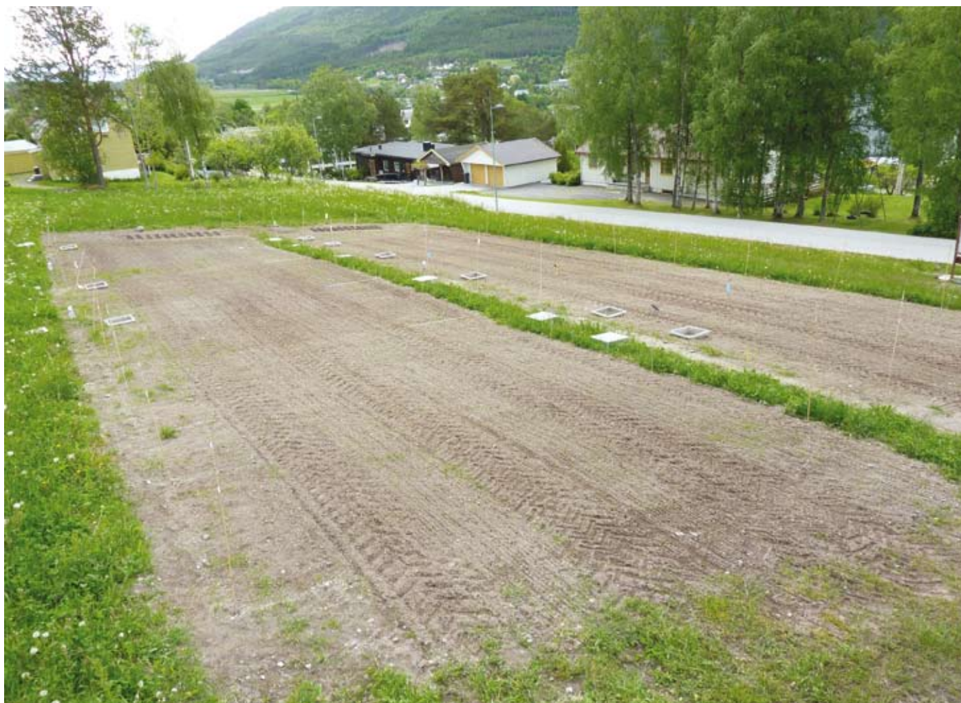
Figur 1. Måling av lystgass ble utført i kasser i feltforsøket i SoilEffects 2012, her i åkerdelen av forsøksfeltet.

Metanproduksjonen fjerner energi i form av karbon fra husdyrgjødsla, slik at råtneresten vil inneholde mindre organisk materiale enn ubehandlet husdyrgjødsel. Andelen mineralsk nitrogen (N) av total N-innholdet er noe høyere enn i ubehandla gjødsel. I økologisk landbruk er det viktig å gjødsle jorda, ikke bare plantene. Jordlivet trenger energi og næring for å kunne bidra til ei fruktbar jord. Når gjødsla blir til råtnerest, vil det da gi dårligere vilkår for jordlivet og dårligere jordfruktbarhet på sikt? Eller vil kanskje avlingene bli større og dermed gi mer organisk materiale i jorda i form av røtter og planteavfall? Bioforsk Økologisk har fått forskningsmidler over jordbruksavtalen via Norges forskningsråd til prosjektet «Biogassbehandling av husdyrgjødsel – hvordan påvirker det