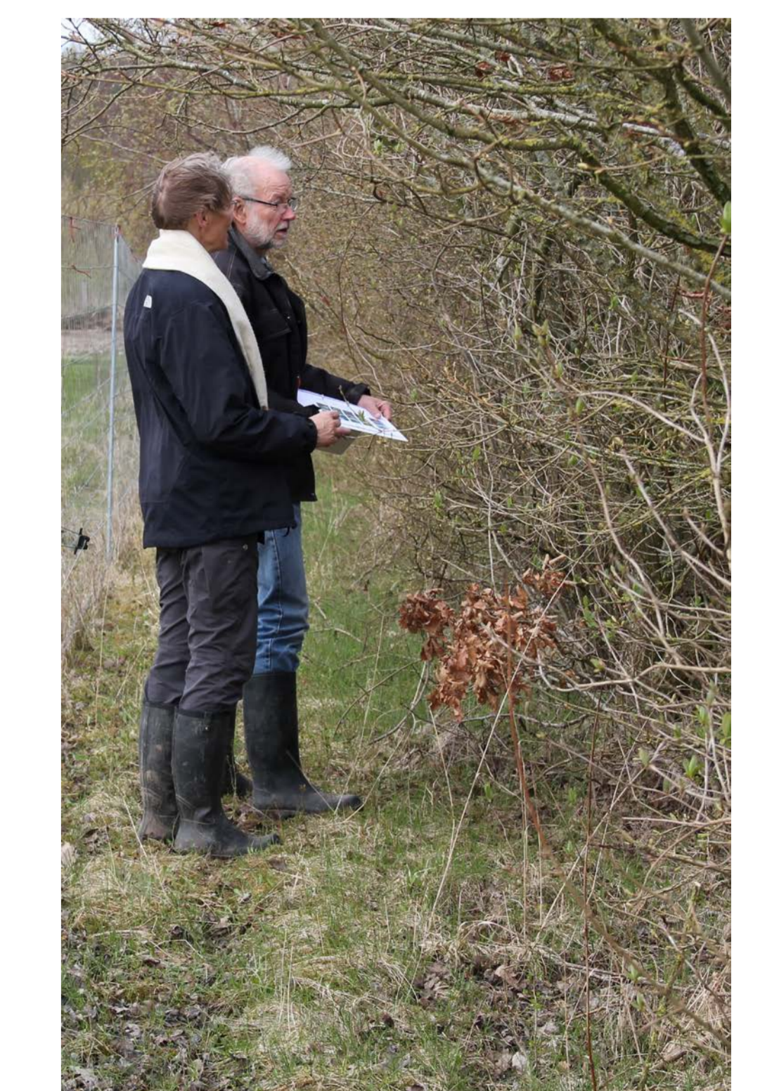
Hegnet omkring frugtplantagen vurderes

Registreringsarket viser eksempler på bi-planter. Arket udfyldes for hver habitat på bedriften fx hegn, enge og skel.