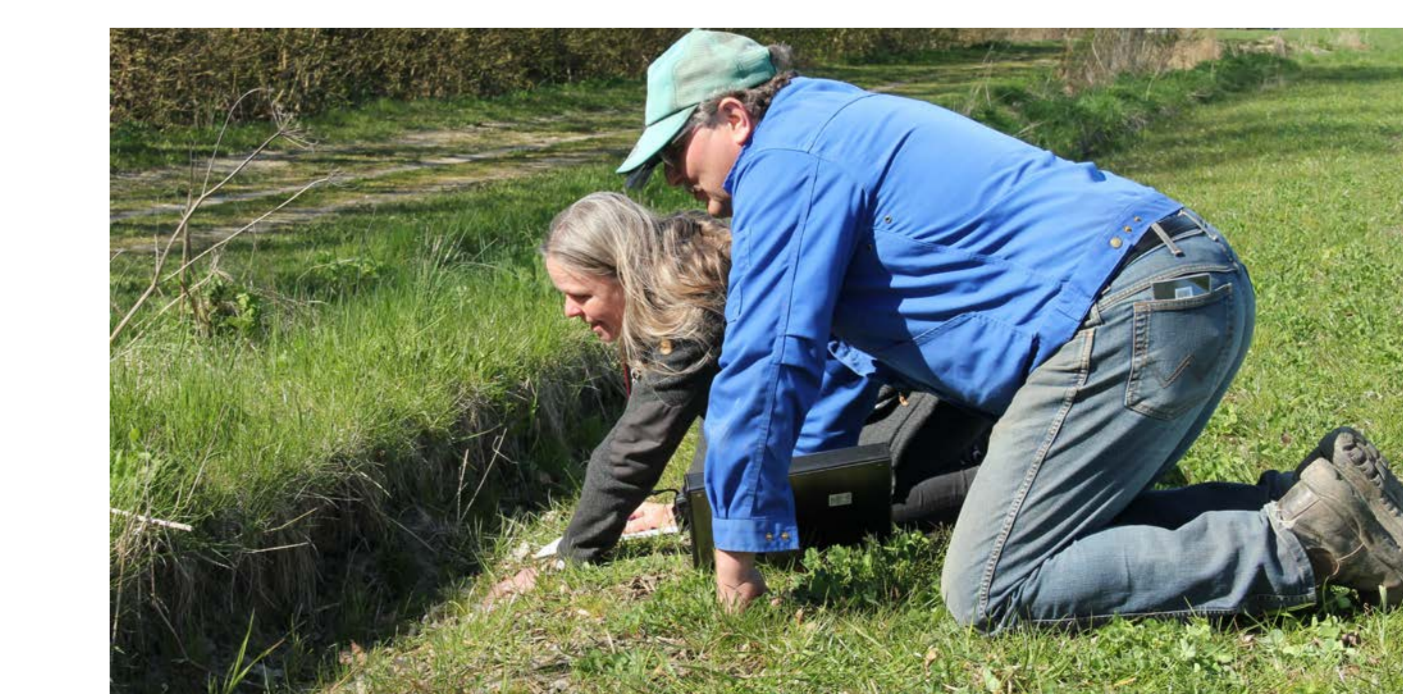
Der kigges efter redesteder