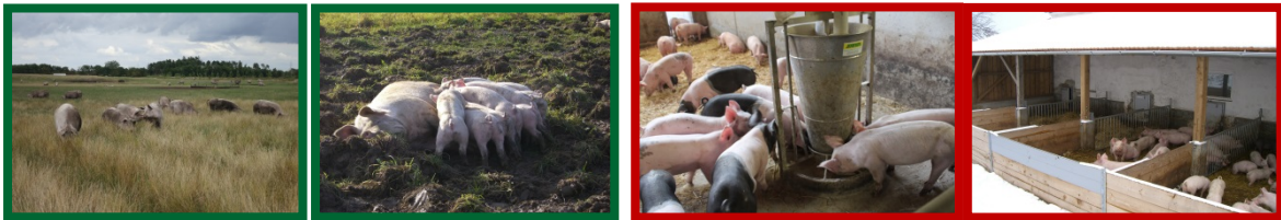
Abbildung 1 Beispiel für die häufigste Kombination auf Betrieben mit teilweiser Freilandhaltung (Tragende und laktierende Sauen im Freiland, Aufzuchtferkel und Mastschweine im Stall mit Auslauf