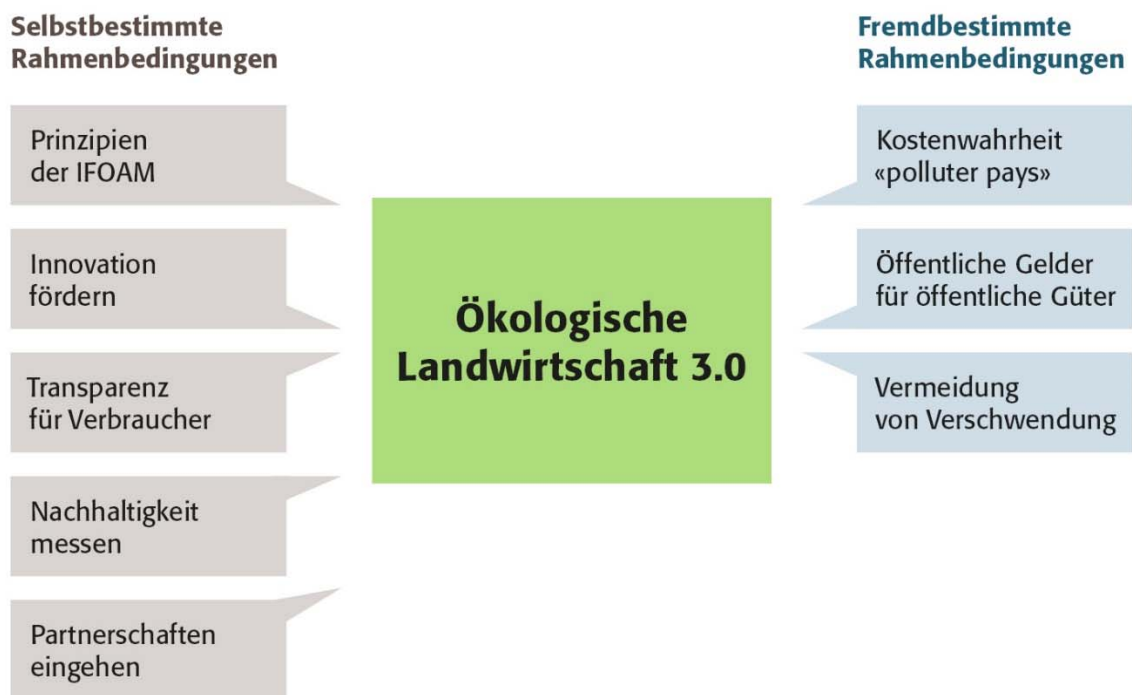
Abbildung 4: Rahmenbedingungen für die Weiterentwicklung des Biolandbaus von 2.0 zu 3.0.

Die Weiterentwicklung des Konzeptes Bio 3.0 und seine Umsetzung ist an verschiedene Rahmenbedingungen und Voraussetzungen gebunden, welche im Folgenden beschrieben werden. Die Rahmenbedingungen sind einerseits extern, d.h. fremdbestimmt – die Verbände des Ökolandbaus können sie nicht selbst regeln. Andererseits gibt es interne, d.h. selbstbeeinflusste Rahmenbedingungen, welche hauptsächlich durch die Arbeit und konzeptionelle Weiterentwicklung der Verbände des Ökolandbaus verändert werden können (siehe Abbildung 4).