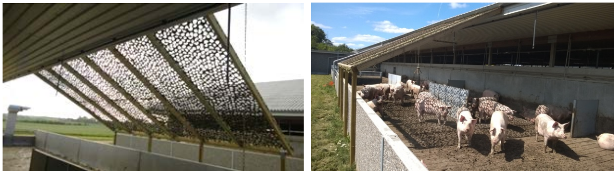
Figur 9. Camouflagenettet over en del af det dræned gulv i udearealet i sektion 1. Camouflagenettet målte 6 m. Formålet med camouflagenettet var at skabe mere skygge i udearealet og derved få grisene til at lægge sig i dette område. Derved var hensigten, at grisene fravalgte området som gødeområde og i stedet koncentrerer gødningsafsætningen på et mindre areal af udeområdet.