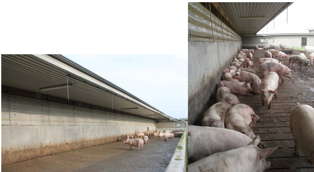
Figur 2. Udeareal som stalden så ud før iværksættning af forsøgs-tiltag. Udearealet målte 39,6 m x 6 m og betongulvet bestod af en kombination af drænet gulv og spaltegulv. Taget dækkede halvdelen af udarealet (3 m). Der er en plantegning i figur 4, som viser placering og fordeling af drænet gulv henholdsvis spaltegulv. Grisene blev ofte set ligge op ad bygningen under tagudhænget.