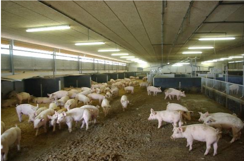
Figur 3. Indearealet målte 39,6m x 9m og gulvet bestod af en kombination af fast gulv og spaltegulv. Modsat liggearealet var der spaltegulv, hvoraf noget af arealet (vist bageste i billedet) var med sorteringsvægte i et fodringsområde. Der er en plantegning i figur 10, som viser foderområdet og fordelingen/placeringen af spaltegulv henholdsvis fast gulv.

I besætningen blev anvendt vådfoder, der var hjemmeblandet og var baseret på fermenteret korn. Stalden var udstyret med sorteringsvægte i kombination med vådfoder efter ædelyst.