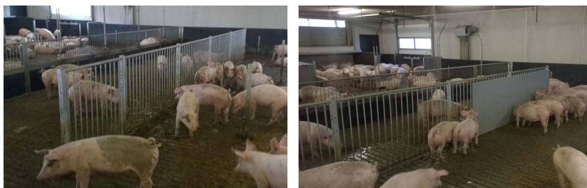
Figur 11. Gødevæg af åbent inventar på spaltegulv (venstre) og samme væg med påsat plade (højre) i stald 2. Formålet var at gøre det mere attraktivt for grisene at gøde i nærheden af dette, da de der havde øget mulighed for trynekontakt og skulle "gå længere væk" fra lejjet.

I det følgende er der fotos af tiltagene illustreret på figur 10.