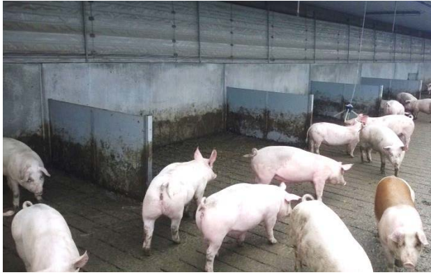
Figur 7. Liggevægge, her lange liggevægge vinkelret på staldbygningen (2 m lange) i sektion 1. Formålet med liggevæggene var at gøre det mere attraktivt for grisene at betragte det som et attraktivt liggeområde og derved undgå gødningsafsætning i området.