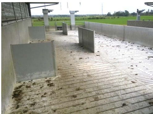
Figur 8. Liggevægge placeret anderledes end i figur 7 men med samme formål. Der er korte liggevægge vinkelret på staldbygningen (1 m lange) og lange liggevægge midt i udearealet placeret parallelt med staldbygning (3 m lange). De var ca. 1 m høje for at kunne skabe skygge bag væggen.