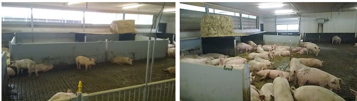
Figur 12. Afspærring af "overskydende redekasser", (venstre), som efter "åbning" udgjorde en forlængelse af liggevægge (højre) i stal 2. De aflukkede redekasser/forlængede liggevægge var 4,5 m lange, hvilket var 2,5 m længere end standardliggevæggene. Formålet med aflukning af redekasser var en forhåbning om mindre gødning på det faste gulv – ikke alene når de var afspærrede, men også når de blev åbnet igen - mens formålet med de forlængede liggevægge var mindre gødning på det faste gulv, flere attraktive liggepladser og færre benproblemer i form af mindre løb igennem stien.

Efter ca. 7-10 dage blev aflukningen af redekasserne fjernet, mens de forlængede liggevægge blev bibeholdt (figur 12, højre). Begrundelsen for at fjerne aflukningen var, at grisene var blevet større og havde behov for et større liggeområde. Formålet med at bibeholde liggevæggene var at lave flere attraktive liggepladser op ad en væg og derved få mindre gødning på det faste gulv.