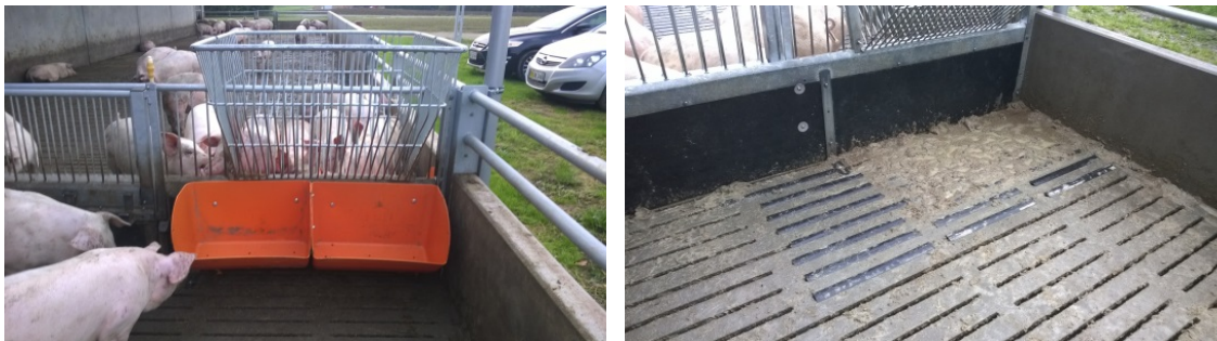
Figur 5. Grovfoderhæk med fastmonteret krybbe (venstre) og grovfoderhæk med fast gulv (højre) i stald 2. Det faste gulv var spaltegulv med spaltelukkere. Formålet var at få flere grise ud i udearealet og i længere perioder ad gangen. Derved var forhåbningen, at de i højere grad ville gøde udendørs fremfor indendørs. Typen med krybber havde til formål at holde grovfoderet rent og derfor mere attraktivt, fordi grovfoderet på det faste gulv kunne antages at blive tilsvinet af gødning på grisenes klove, som tilfældet er på fotoet til højre.