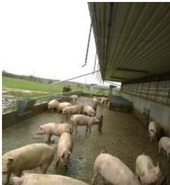
Figur 4. Overbrusning på yderste del af udearealet (venstre side af billedet) i stald 1. Formålet var at få grisene til at gøde på den våde del og derved holde tørt på det resterende.

I det følgende er vist fotos af de tiltag, som blev etableret: