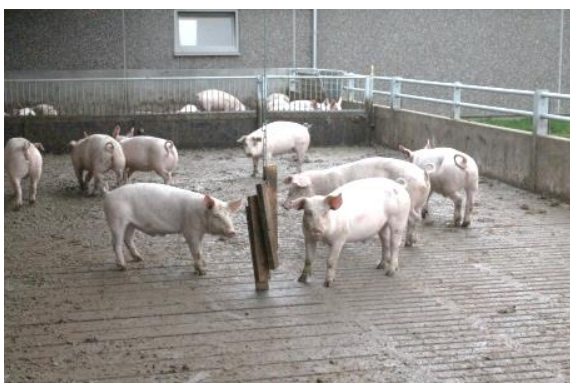
Figur 6. Trælægter ophængt i kæder i sektion 1. Formålet var, at skabe mere aktivitet i det ønskede gødningsområde