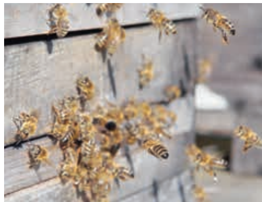
An warmen Frühlingstagen beginnen erste Reinigungsflüge sowie das Sammeln von Pollen.