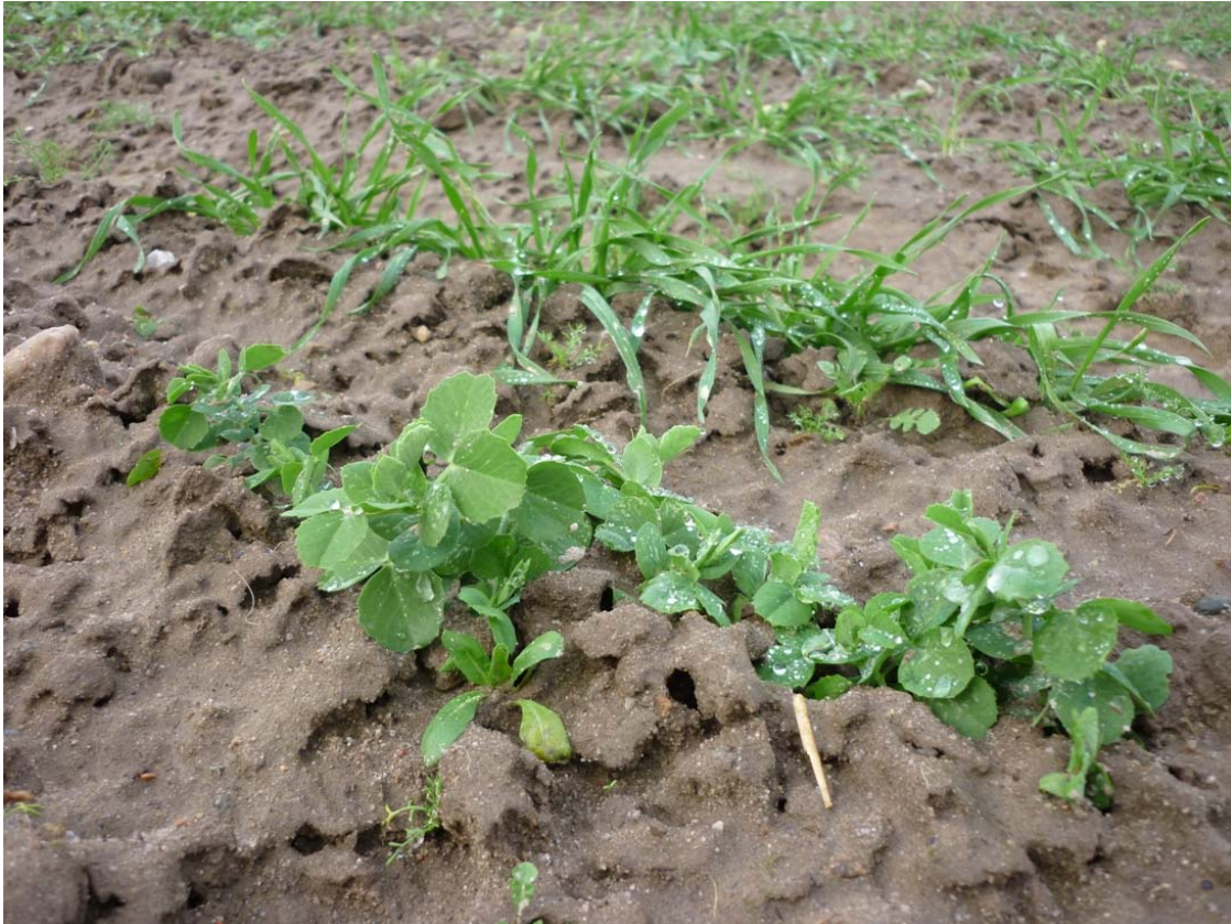
Abbildung 1: Wintererbsen im Stadium des gedrunenen Wachstums in der Überwinterungsphase

Finanzielle Förderung: Seidlhof-Stiftung, Irminfriedstraße 21a, 82166 Gräfeling