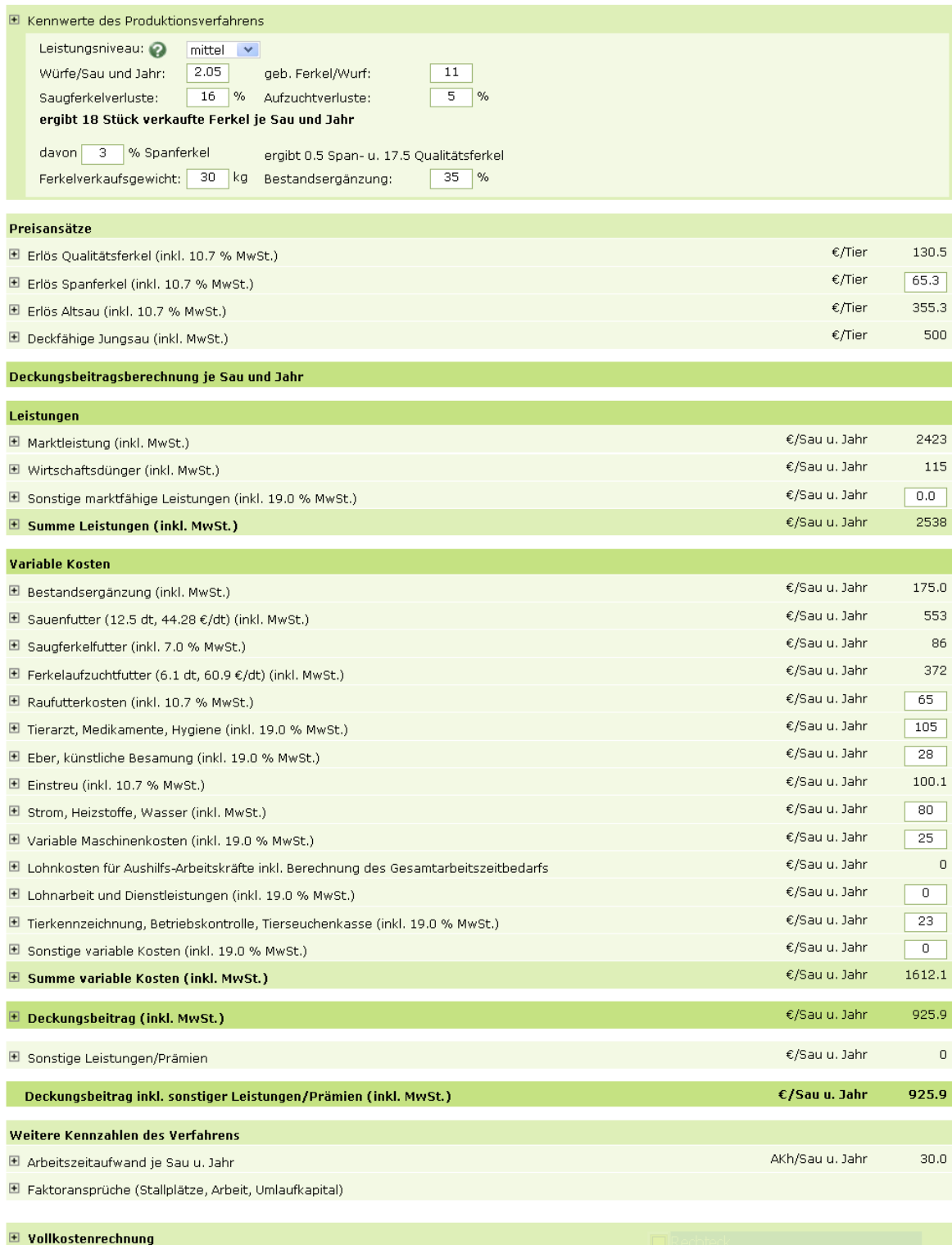
Tab. 1: Deckungsbeitrag in der Öko-Ferkelerzeugung bei einem mittleren Leistungsniveau im Betrachtungszeitraum der zurückliegenden 12 Monate