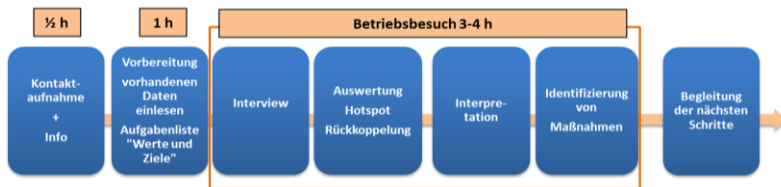
Abbildung 1: Darstellung des Gesamtkonzeptes des Beratungsvorgangs. Eigene Darstellung.

Auf Grundlage des Gesamtkonzeptes und den ersten Erfahrungen im Projekt wurde folgende Vorgehensweise für die Nachhaltigkeitsberatung erarbeitet (Abb. 1):