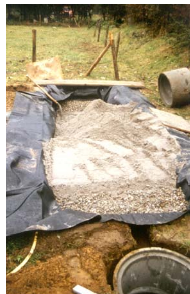
Abb. 2: Wurzelraumklärbeet während der Bauphase

Eine ausführliche Bauanleitung (mit farbigen Abbildungen) kann vom Verfasser zum Preis von DM 30,- bezogen werden.