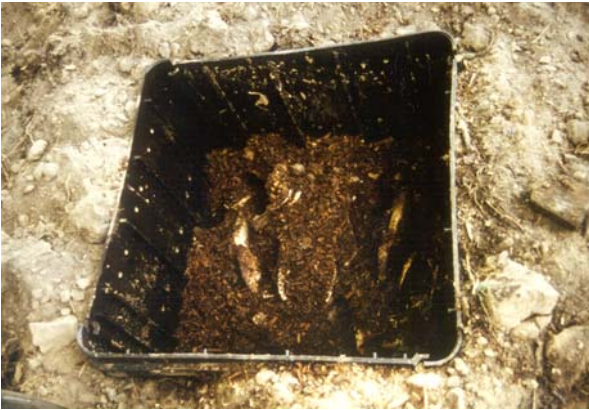
Abb. 3: Schnellkomposter zur Schädelsäuberung

wird immer wieder kontrovers diskutiert. Da R. Steiner von einem „Knochengefäß“ sprach, ist davon auszugehen, das der von Fleischresten gesäuberte Schädel gemeint ist. Andernfalls würde der Schädel in einem Milieu von sich zersetzender tierischer Substanz liegen, nicht in der gewünschten Pflanzensubstanz.