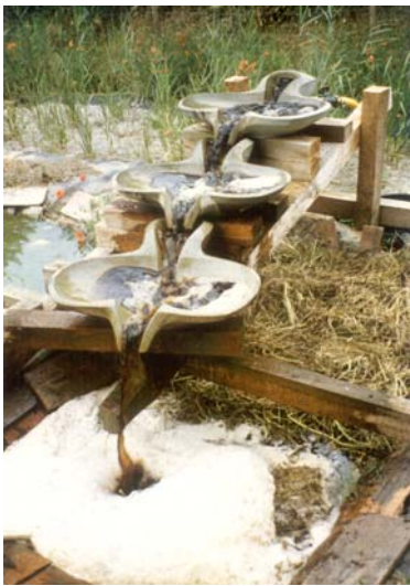
Abb. 1: Frisch beschicktes Pflanzenschlammbeet mit Flowformkaskade, Typ „Garden“; im Hintergrund das Wurzelraumklärbeet

Betrachtet man die derzeit üblichen Verfahren der Herstellung des Eichenrinde-Präparates, so läßt sich unschwer erkennen, daß dieses Präparat eine besondere Herausforderung an den biologisch-dynamischen Landwirt darstellt.