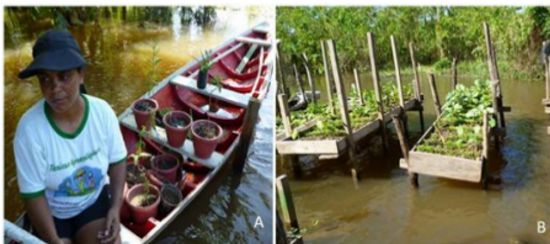
Figura 02 (A e B): A) Plantas medicinais cultivadas em vasos no período da enchente; B) Canteiros suspensos adaptados para o período da cheia na comunidade São Francisco, localidade Costa da Terra Nova, Município de Careiro da Várzea/AM.

Observa-se, na tabela 01, que 95% dos informantes na comunidade São Francisco, citam com maior frequência as espécies medicinais aromáticas e condimentares, fato que revela uma maior agrobiodiversidade nas unidades produtivas da referida comunidade. Tal fato se explica pela localização da comunidade São Francisco em uma área de várzea alta, ou seja, que apenas sofre inundação total em épocas das grandes enchentes. Entretanto, Santa Luzia do Baixo localiza-se em áreas de várzea baixa, e está mais propensa às inundações anuais. Este resultado corrobora com