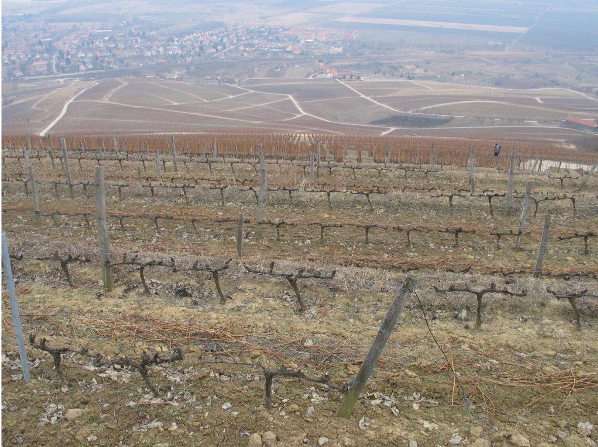
3. kép. Szőlősorköz-gyepesítési kísérlet helyszíne Tokajban.

távlati célja, hogy a biogazdálkodók számára rendelkezésre álljon a hazai flórában honos fajokból álló, magyarországi előállítású, fajgazdag takarónövényzet létrehozására alkalmas magkeverék, mely alkalmas a szőlőben tapasztalható eróziós károk, talajtömörödés csökkentésére, a talajélet élénkítésére valamint a minőségi termelés és a biodiverzitás növelésére.