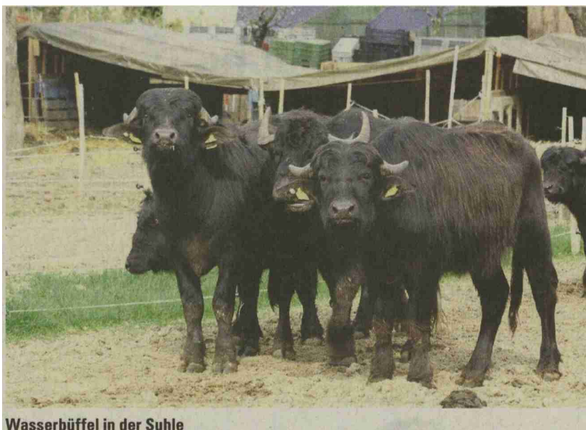
Wasserbüffel in der Suhle

und Vermarktung der Büffelmilch auf. Die Marktchancen für Büffelmilch stehen gut. Wir besuchen ausgiebig zwei interessante Büffelbetriebe. Einer stellt von Holstein auf Büffel um und der andere nutzt die Büffel für die Pflege von Naturschutzflächen. Das Kursprogramm kann bei elisa.lucia@fiBL.org oder unter www.bioaktuell.ch angefordert werden. Für weitere Auskünfte steht Eric Meili vom FiBL gerne zur Verfügung: Tel. 055 243 39 39, E-Mail: eric.meili@fiBL.org