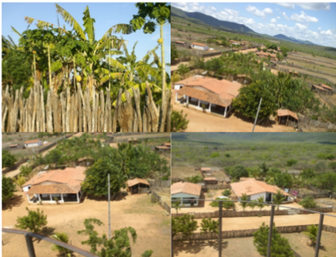
Figura 1: Imagens parciais dos quintais produtivos do Assentamento Alegre, Quixeramobim/CE. Fevereiro de 2010