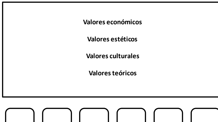
Figura 1. Loa valores más comunes considerados por las OPC.

*Elaboración propia con información de Lozano, D. et al 2014