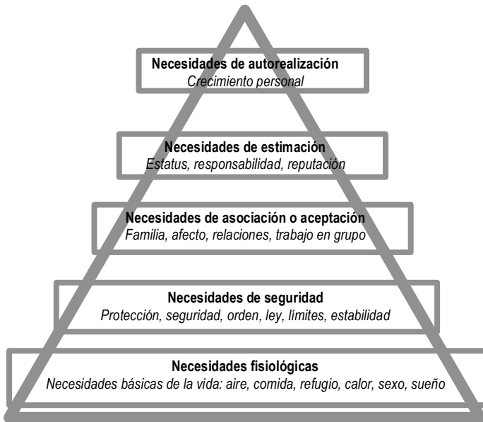
Figura 1. Jerarquía de las necesidades de Abraham Maslow