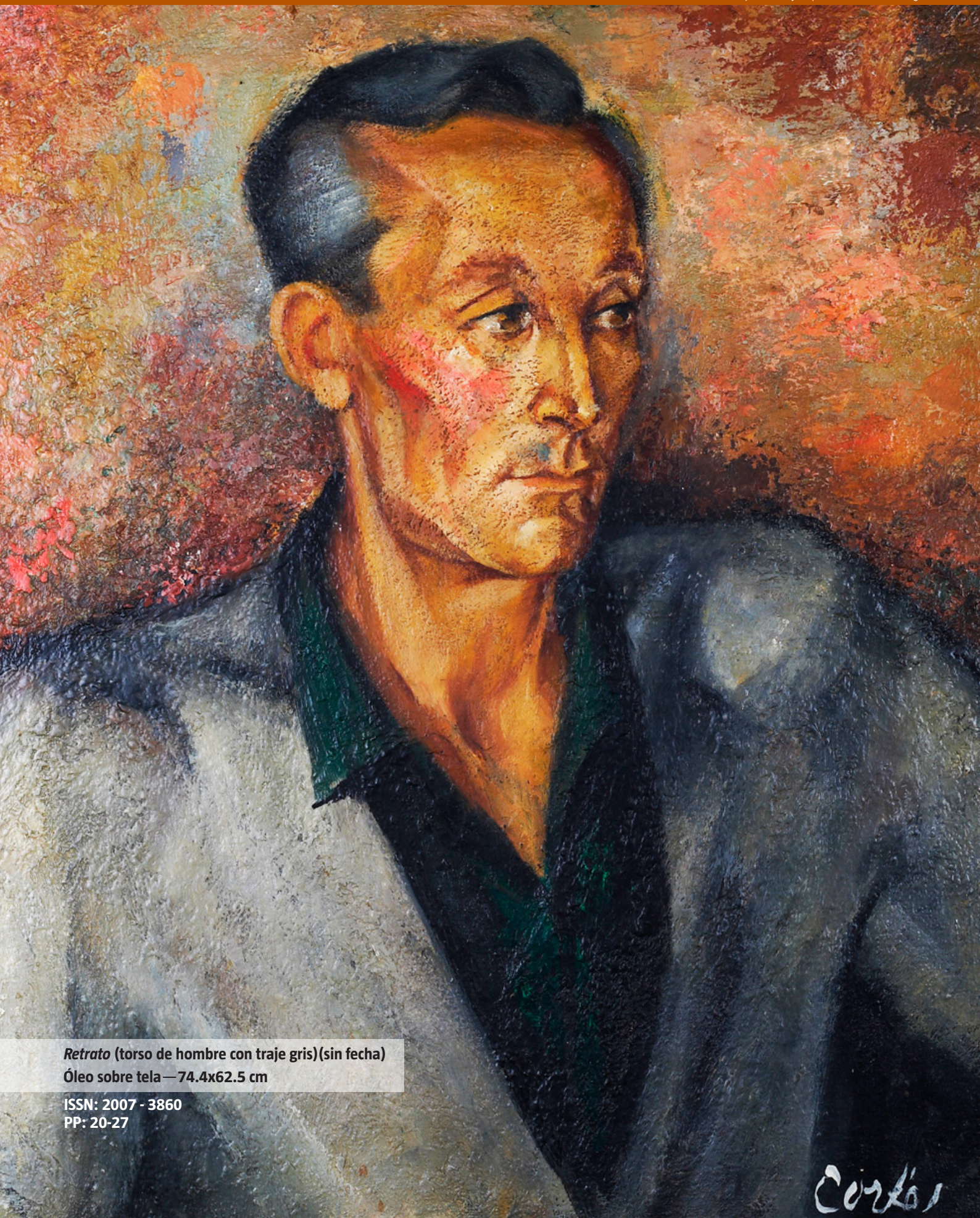
Retrato (torso de hombre con traje gris) (sin fecha) Óleo sobre tela— 74.4x62.5 cm