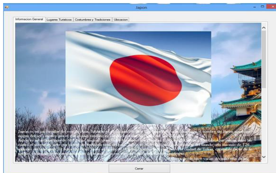
PANTALLA NO.2 Resultado de búsqueda

En esta Pantalla no.1, El programa nos pide que elijamos el país del cual deseemos saber información, para posteriormente mostrarnos Pantalla no.2, que nos da el resultado de la búsqueda, como a continuación se presenta.