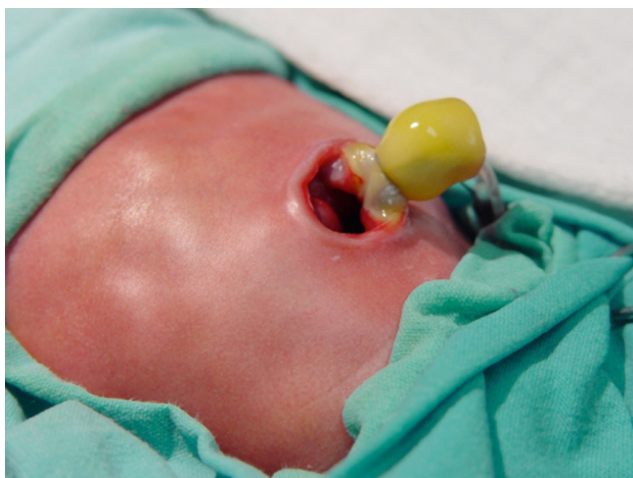
Figura 2. Caso 1. Asas intestinales reintroducidas por el mismo defecto abdominal sin ampliarlo.

Previa autorización por la madre se decide incluir en el protocolo de recambio de líquido amniótico. Se inicia primer recambio a las 30.3 SEG, el segundo recambio a las 32.3 SEG y el