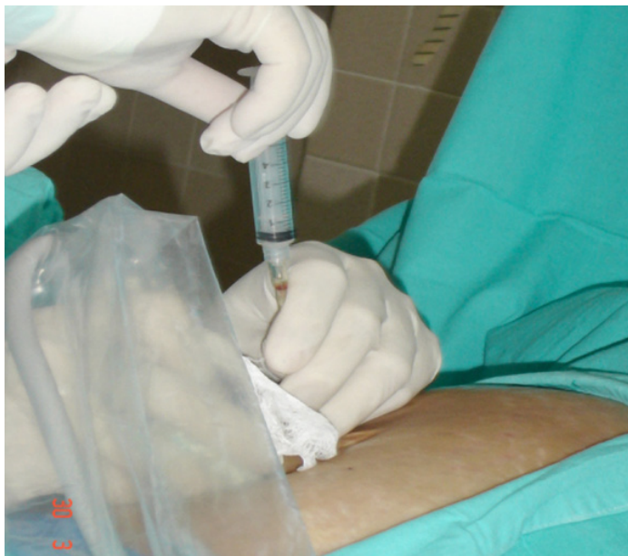
Figura 6. Punción uterina guiada por ultrasonido

El tiempo quirúrgico fue de 65 minutos. Permanece 3 días intubado.