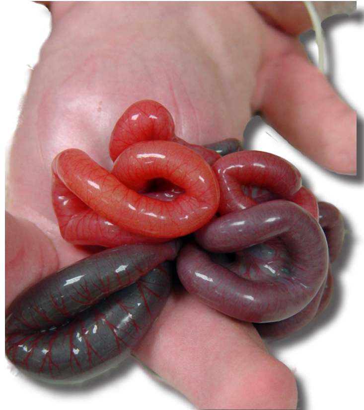
Figura 1. Caso 1. Asas intestinales sin perivisceritis

Se egresa a los 39 días de vida extrauterina al ganar el peso adecuado para su alta a los 2 Kg. de peso, según protocolo institucional.