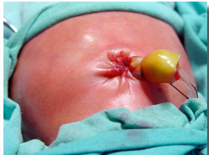
Figura 3. Caso 1. Defecto abdominal cerrado