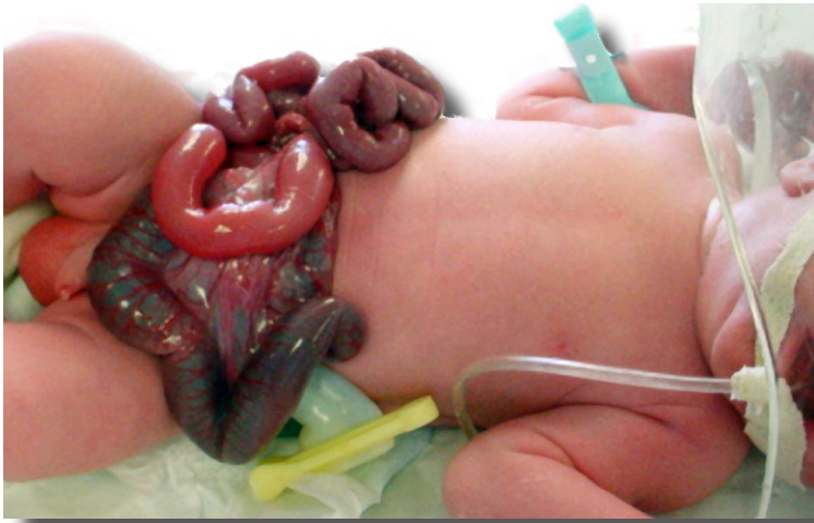
Figura 4. Caso 2. Asas intestinales sin perivisceritis

tercer recambio a las 35.2 SEG. Se obtiene por cesárea a las 37 SEG, producto masculino de peso 2460 gr. con Apgar de 8/9.