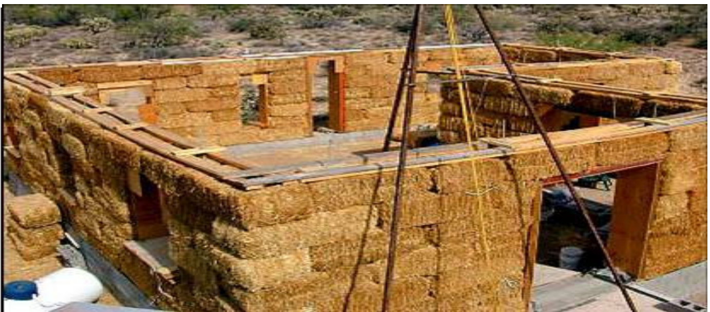
Figura 3. Casas de paja