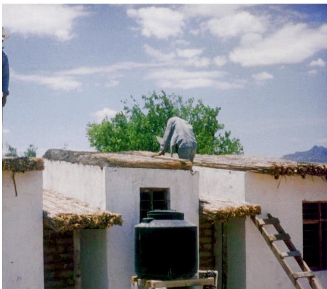
Figura 5. aplicaciones del kenaf en la construcción

Los paneles de Kenaf se fabrican en densidad y espesores diferentes para satisfacer cualquier necesidad. Los paneles y rollos en fibra de Kenaf no tienen contraindicaciones y pueden ser utilizados para cualquier tipo de aplicación. Los paneles aislantes fabricados en fibra de Kenaf no solo son ecológicos y bionaturales, sino que constituyen un excelente aislante térmico y acústico, idóneo para su uso en obra nueva y rehabilitación. Asimismo, se trata de un producto ecosostenible y reciclable, que puede ser termofijado sin necesidad de colas. Inalterable al ataque de insectos roedores y volátiles, no se pudre ni libera sustancias contaminantes.