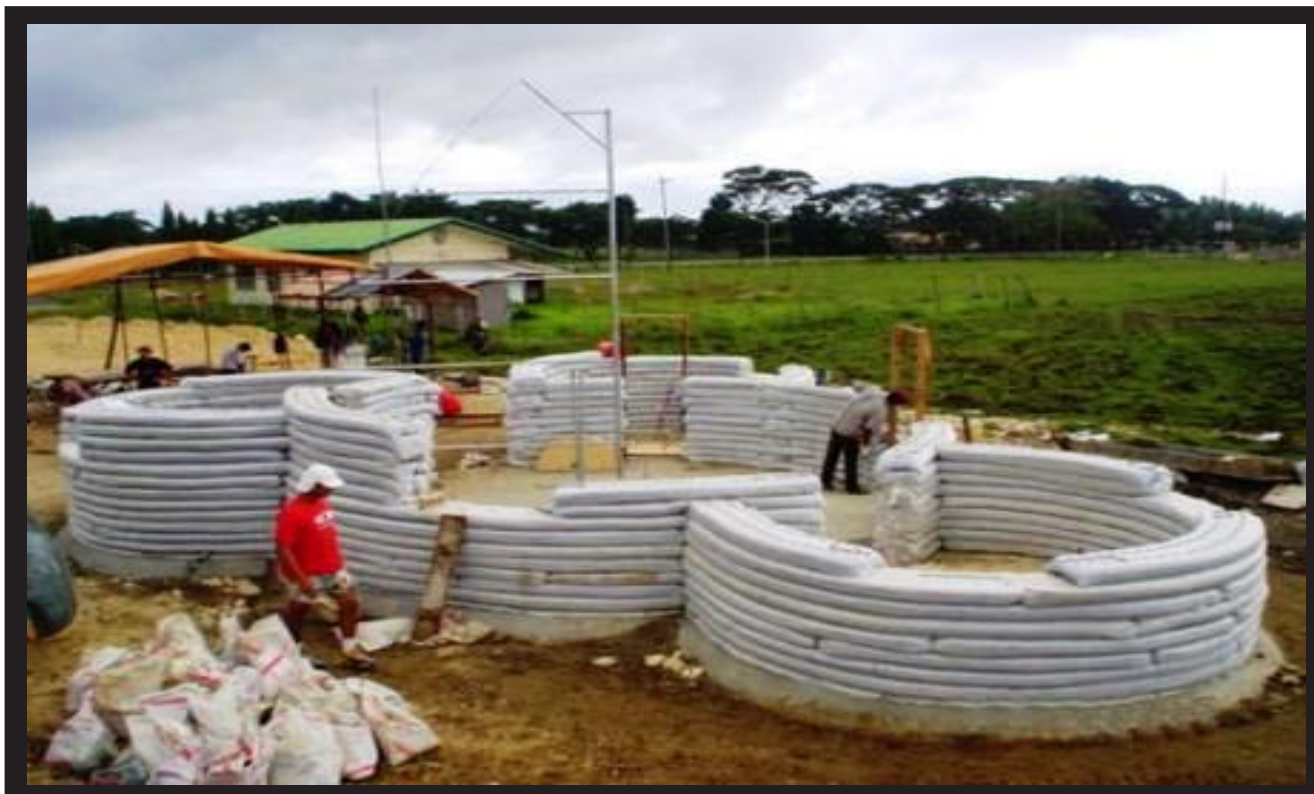
Figura 4. Uso del superadobe en las construcciones