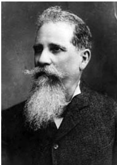
Figura 1. General Bernardo Reyes, padre de Alfonso.

Alfonso Reyes Ochoa nació en Monterrey, Nuevo León, el 17 de mayo de 1889 a las nueve de la noche. Fue hijo del General porfirista Bernardo Reyes, quien gobernó el estado durante tres periodos alternos entre 1885 y 1909, y de doña Aurelia Ochoa de Reyes 7,8 (figura 1).