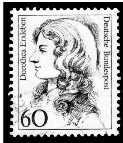
Figura 1. Dorothea Christiane Erxleben. Sello germano de 1987, “Serie de Mujeres en la historia alemana”.

sometida por tener expectativas diferentes. Con inapreciable léxico, arguye la habilidad filosófica y científica; señala que el conocimiento está distribuido equitativamente entre géneros, pero que la mitad de la humanidad no tiene acceso a la buena educación para desarrollarse.* Usa su conocimiento filosófico, teológico y científico para describir dos milenios de misoginia de los líderes de la Iglesia, filósofos y hombres de ley.