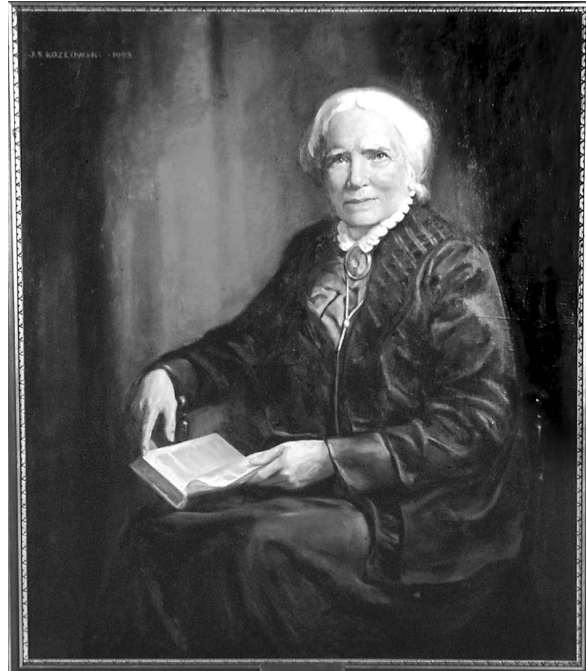
Figura 2. Elizabeth Blackwell, 1963, retrato de Joseph Stanley Kozlowski.

Nombró a la doctora Rachel Cole, primera mujer afroamericana que se graduó de medicina en Estados Unidos, como su compañera en la dirección del establecimiento. 3