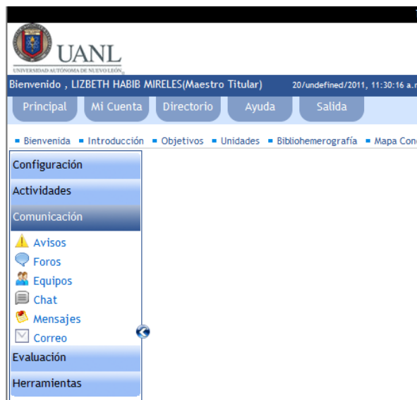
Figura2. Herramientas de comunicación plataforma NEXUS

En el cuarto apartado aparecen varias opciones, de las cuales se utilizaba la calificación basada en estadísticas, la cual no es una prioridad para el tutor, en este apartado se puede observar el total de estudiantes que se encuentran participando y el cumplimiento o no de sus actividades de seguimiento y reportes hacia el tutor.