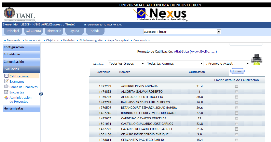
Figura3. Herramientas de Calificación plataforma NEXUS

En el cuarto apartado aparecen varias opciones, de las cuales se utilizaba la calificación basada en estadísticas, la cual no es una prioridad para el tutor, en este apartado se puede observar el total de estudiantes que se encuentran participando y el cumplimiento o no de sus actividades de seguimiento y reportes hacia el tutor.