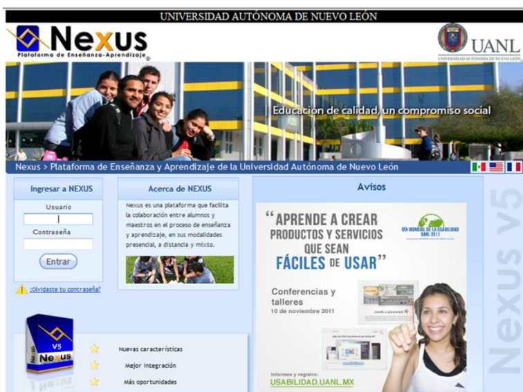
Figura1. Página de inicio plataforma NEXUS (www.nexus.uanl.mx)

Es por lo anterior que se implemento la tutoría por medio del uso de la plataforma NEXUS, para realizar la entrega de reportes, compartir sus puntos de vista en los foros de discusión, conversaciones en tiempo real por medio de chats, evaluación de reportes, cumplimiento, entre otros beneficios. Lo cual detallaremos a continuación: