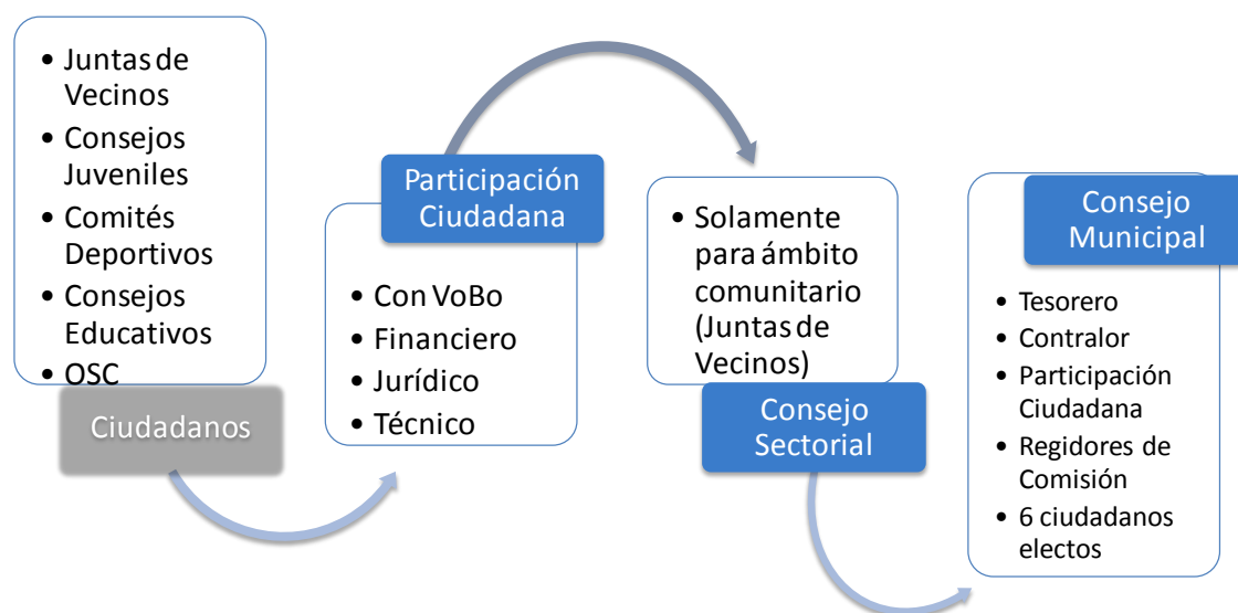
Figura 5 Proceso del programa “Yo Decido con San Pedro”

Elaboración propia con información de Reglamento de Presupuesto Participativo del municipio de San Pedro Garza García, N.L.