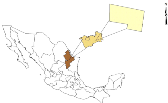
Fig. 1. Localización del área de estudio.

La presente investigación se desarrolló en una comunidad del matorral espinoso tamaulipeco del municipio de Linares, N. L. (NE de México, figura 1). Las coordenadas de ubicación son 25° 09' y 24° 33' de la latitud norte, y 99° 54' y 99° 07' de longitud oeste, con una altitud de 350 msnm. Las especies leñosas que destacan por su abundancia y cobertura son: Acacia rigidula , Acacia farnesiana , Pithecellobium pallens , Cordia boissieri , Karwinskia humboldtiana y Prosopis glandulosa . 9