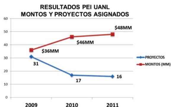
Fig. 2. Programa de Estímulos a la Innovación/UANL, 2009-2011.