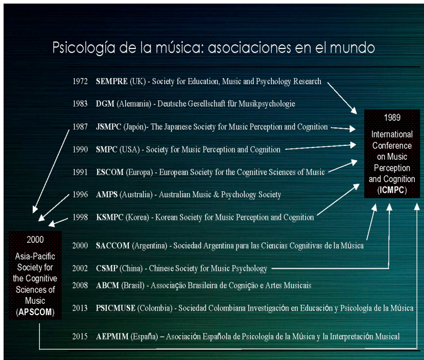
Figura 2. Asociaciones sobre psicología de la música a nivel internacional y año de fundación.

que tiene que ver con definiciones fundamentales del campo de la epistemología?” (comunicación personal). La revista Epistemus abre por fin el camino a las publicaciones especializadas en psicología de la música en español, y esperamos que este sea sólo un primer paso hacia el establecimiento de una estructura sólida que garantice una actividad duradera. Más allá de las actividades de prevención e intervención, el objetivo global de AEPMIM podría ser alcanzar una psicología de la música que permita aunar a los músicos y a los psicólogos entre sí, que les permita comprender que se necesitan mutuamente, y ello promueva la motivación que sustente esa colaboración entre ambos tan necesaria, tan conveniente, pero todavía difícil.