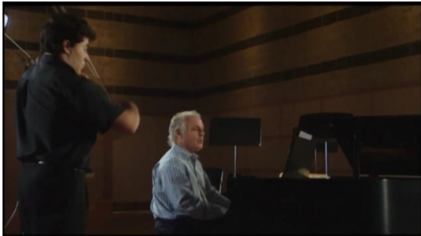
Figura 2: Ubicación espacial de los músicos en el comienzo del segmento de video analizado