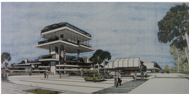
Imagen 2. Perspectiva peatonal del conjunto

Al respecto cabe destacar que en nuestro medio, desde mediados de los ´60 comenzaron a desarrollarse distintos instrumentales y recursos tecnológicos (hardware y software) que incrementaron las herramientas disponibles para dibujantes y diseñadores. Estas nuevas posibilidades gráficas -en un principio destinadas a una "elite tecnológica"-, vinculadas con la expresión o transmisión de ideas y con la retroalimentación del arquitecto durante las distintas instancias del proceso proyectual, debieron vencer las objeciones y cuestionamientos que en un primer momento se le realizaron. Cuestión que, desde los ´80, con el desarrollo de los Procesadores Personales (PC) y su producción masiva, se modificó dando lugar a la irrupción de los medios digitales en todos los ámbitos y actividades.