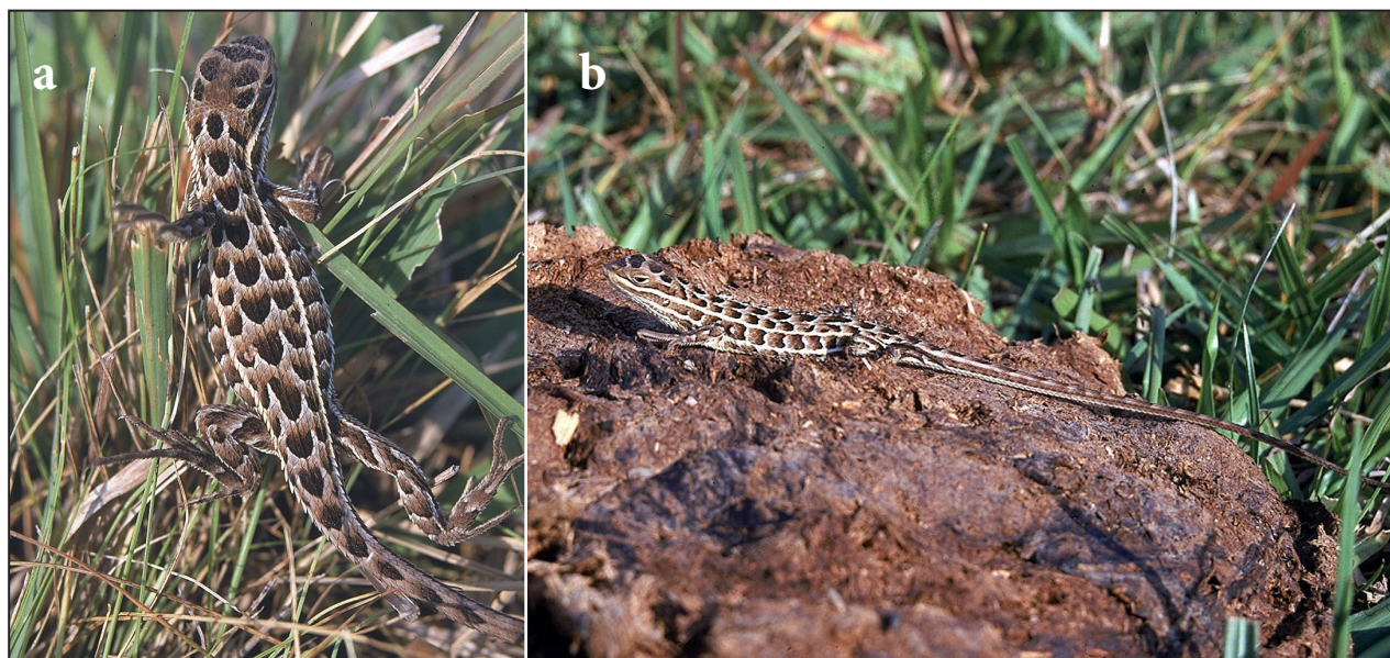
Figura 4. (a) Vista dorsal y (b) lateral de Stenocercus azureus . Colonia Liebig – Playadito.