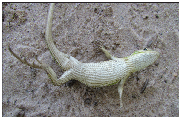
Figura 3. Vista ventral de Stenocercus azureus UNNEC: 13000.

A la Dirección de Parques y Reservas de la provincia de Corrientes por otorgar el permiso de colecta. Al CONICET (beca posdoctoral Etchepare, E. G.) y