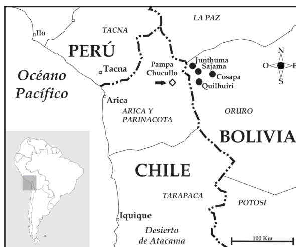
Figura 2. Mapa que exhibe las localidades de Liolaemus pleopholis . Los círculos negros corresponden a los registros locales de L. pleopholis en el departamento de Oruro en el Estado Plurinacional de Bolivia, destacando la ampliación de su distribución geográfica de oeste a este. El rombo blanco representa la localidad tipo de la especie en la Quinceava Región Administrativa de Chile (Arica y Parinacota).

Liolaemus pleopholis exhibe dicromatismo sexual evidente debido a que los machos son más coloridos que las hembras. El color del cuerpo y cabeza en los machos es ocre verdoso y en las hembras castaño o gris. El diseño dorsal es similar en ambos sexos con la presencia de manchas dorsales subcuadrangulares oscuras mucho más evidente en