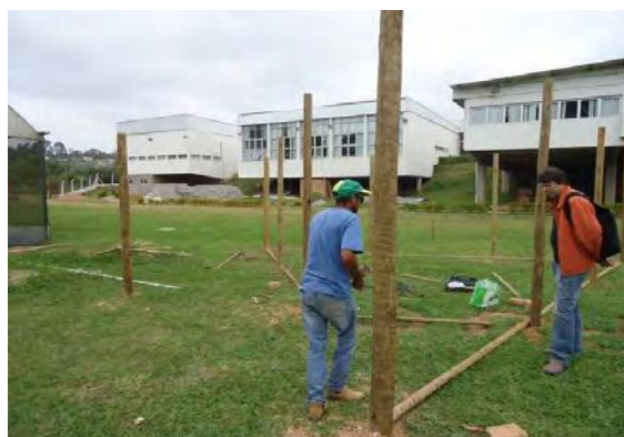
FIGURA 2. Montagem do protótipo da ecosala no campus São Roque do IFSP.

Após a montagem da estrutura básica é feita a ligação de energia e água na rede normal (um ponto de cada). Adicionalmente pode ser comprado uma placa solar e montado um sistema de coleta para a água. As estruturas de telhado e as primeiras duas paredes são feitas durante o primeiro curso de Bioconstrução.