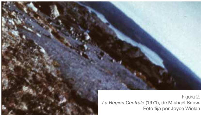
Figura 2. La Région Centrale (1971), de Michael Snow.