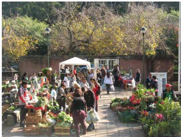
FIGURA 2: Feria Manos de la Tierra

Frente a estas condiciones, las familias comenzaron a participar comprometidamente superando el individualismo para actuar colectivamente en función de objetivos comunes, en este caso, la comercialización en condiciones más justas a las tradicionales. Surgió allí la idea de generar en el predio de la FCAyF una feria de productos de agricultura familiar, propia del proyecto, que permitiera un intercambio directo entre productores/as y consumidores/as. Más adelante, “Manos de la tierra” (como se bautizó a esta feria) crecería instalándose en la Facultad de Ingeniería (FI). Desde entonces, hasta la actualidad se pueden comprar, todos los miércoles en la FCAyF y los viernes en la FI, hortalizas frescas, plantas y flores, miel y huevos.