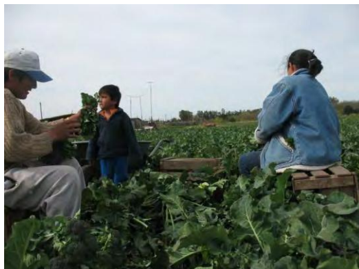
FIGURA 3: Familia productora de la localidad de Arana, que vende en la Feria

“Manos de la Tierra” es producto de la organización de los/as productores/as en el Consejo Social, donde han identificado sus propias problemáticas (aquí nos referimos a la comercialización, aunque en el consejo productores y productoras abordan cuestiones de variada índole) y encontrado el modo de abordarlas. Esto no sólo ha generado un canal de comercialización más justo (debido a los mejores precios, la ausencia de intermediarios, la valoración de los productos en relación a su forma de producción, entre otros) sino que representa una forma de empoderamiento y un aumento de la autoestima para los/as feriantes, que intercambian sus saberes entre ellos/as y con los/as consumidores en la Feria.