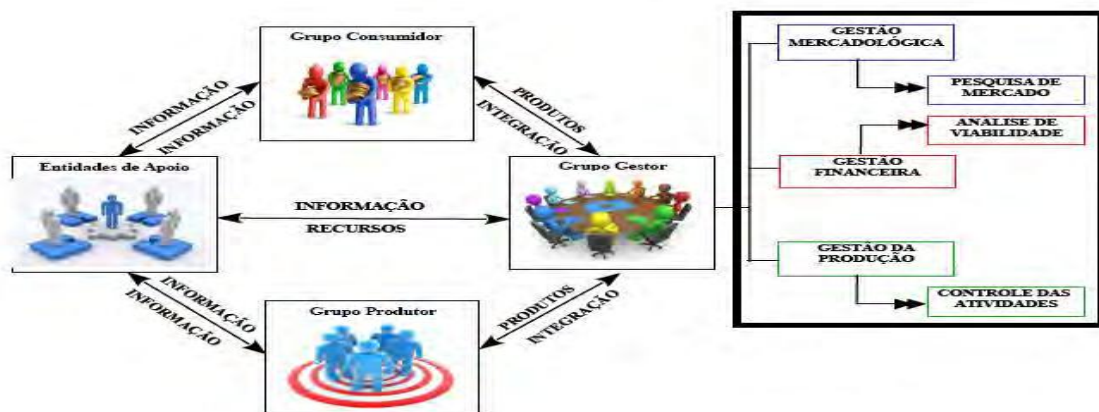
FIGURA 1. Integração e troca de informações dos agentes no Grupo de Compras Coletivas de Alimentos Ecológicos.

Para a consolidação efetiva do grupo de compras coletivas, foram desenvolvidas três atividades principais que estão destacadas na imagem abaixo: Pesquisa de mercado, análise de viabilidade e controle das atividades. A primeira diz respeito principalmente à oferta e demanda. A segunda nos traz a viabilidade de criação do grupo tanto em relação aos preços dos produtos dados pelos e propostos para os agricultores, quanto para os preços propostos pelos consumidores e se poderiam cobrir os custos das atividades no grupo gestor (compra de materiais utilizados). Já a terceira é a que daremos ênfase para a elaboração deste trabalho.